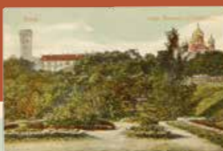
HIRVEPARGI VAADE U 1910

1936. aastal sai kogu pargist lõpuks Tallinna linna omand ja sellest kujundati avalik park linlastele. Wismari ja Toompea tänavate nurgal olev aed kujundati maastikuaias stiilis looklevate jalutusteedega pargiks, kus tihedamad osad vaheldusid väikeste pargiaasadega. Pargi juurdelõige, kus ilmneb funktsionalistlikule pargistilile omaseid jooni sirgete teede, ristkülikukujuliste muru- ja terrassipindade ning platsidega, ehitati 1935. aastal. Selles osas paikneb tänapäeval suur laste mänguväljak ja mitmeid skulptuure. Samal ajal rajati trepid pargist välja pääsemiseks, sh ka üles Falgi teele. Hirvepargi ehitamine loeti lõppenuks 1937. aastal, mil park sai tervikliku kuju.