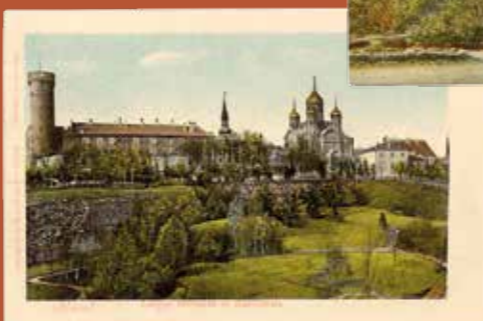
PARK 1907. AASTA PAIKU (ERAKOGU)