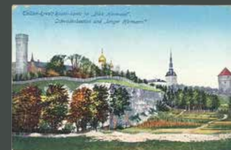
PUUKOOLI-AEGNE HIRVEPARK, U 1903