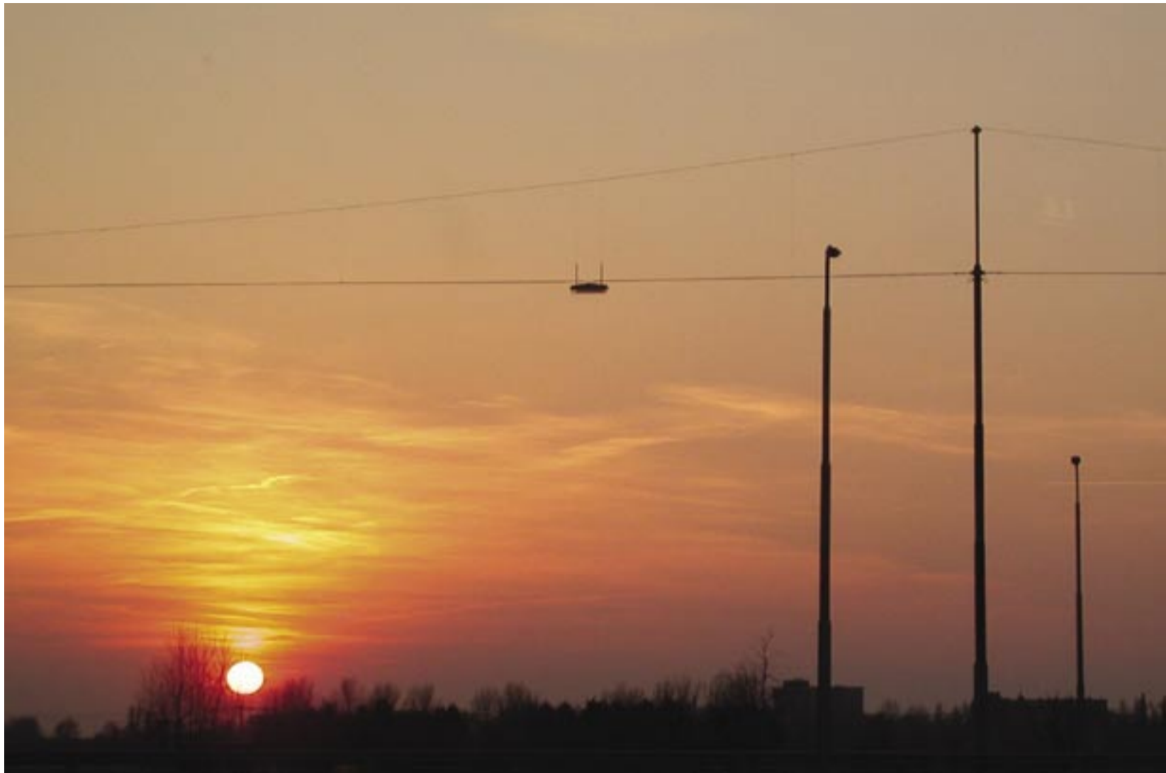
Uuele päevale vastu...