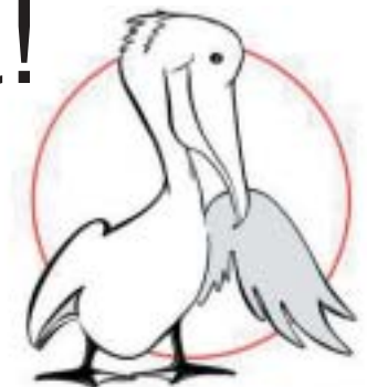
Legendi järgi ei jätlan maailma esimene doonor