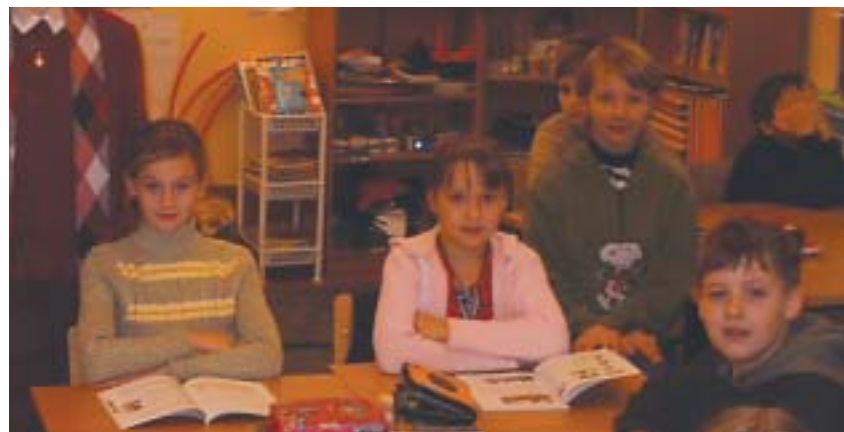
Uudis koolimaja peatsest suurremondist tekitas rõõmsa ärevuse kogu kooliperes.