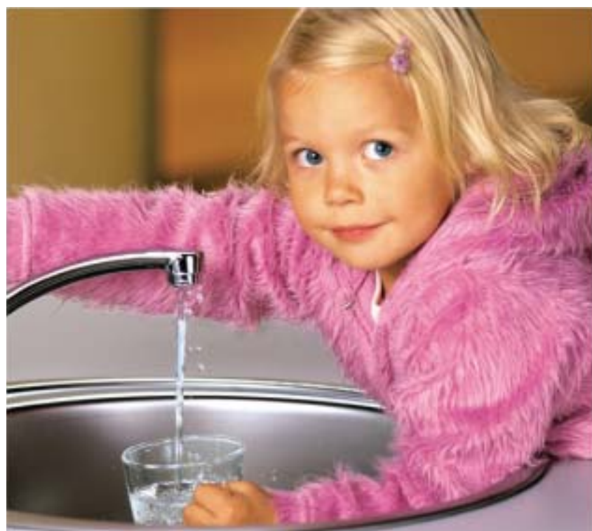
Puhast vett vajab igaüks, alates kõige pisemast.

veetorustike ulatuslikud loputustööd leidsid aset 2002. aasta suvel. Spetsialistide hinnangul tuleb taolisi loputustööd teha umbes iga kolme aasta järel. Tarbijatelt saadud vastukaja põhjal võib öelda, et ka Lasnamäel andsid loputustööd hea tulemuse. Lisaks vee-