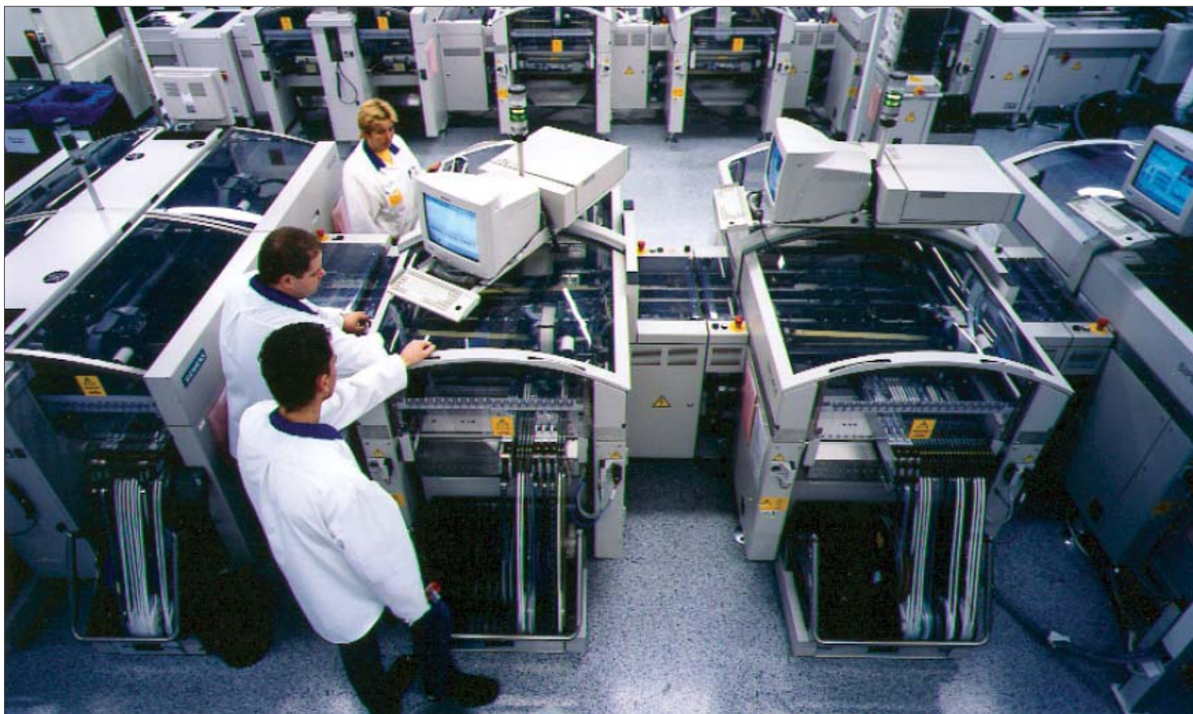
Eesti suurim eksportöör Elcoteq Tallinn kasvab jõudsalt