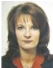
Dei Altsaar Lasnamäe alaealiste komisjoni sekretär

Lasnamäe linnaosavalitsuse alaealiste komisjon arutab nende alla 18-aastaste noorte küsimusi, kes on sattunud seadustega vastuollu. 2004. aastal arutati asju 18 istungil, kokku 325 õigusrikkumise teemal.