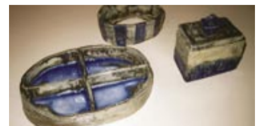
Savistuudio laste tööd

Mahtra noortekeskus on avatud esmaspäevast laupäevani kella 14-20. Lisainfo: 55 567 785, mahtra@taninfo.ee