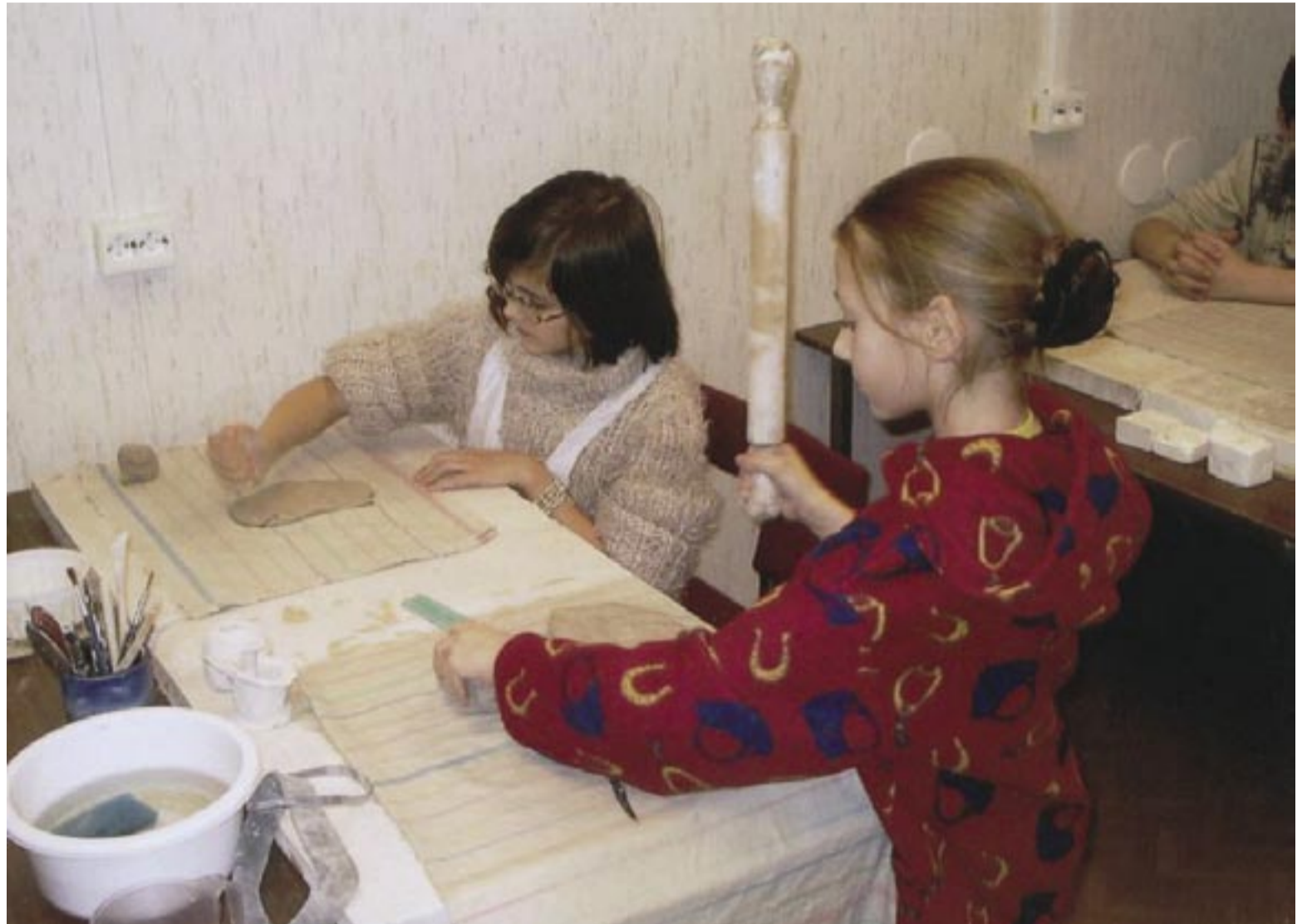
Mahtra Avatud Noortekeskuse savistuudio väikesed loojad.