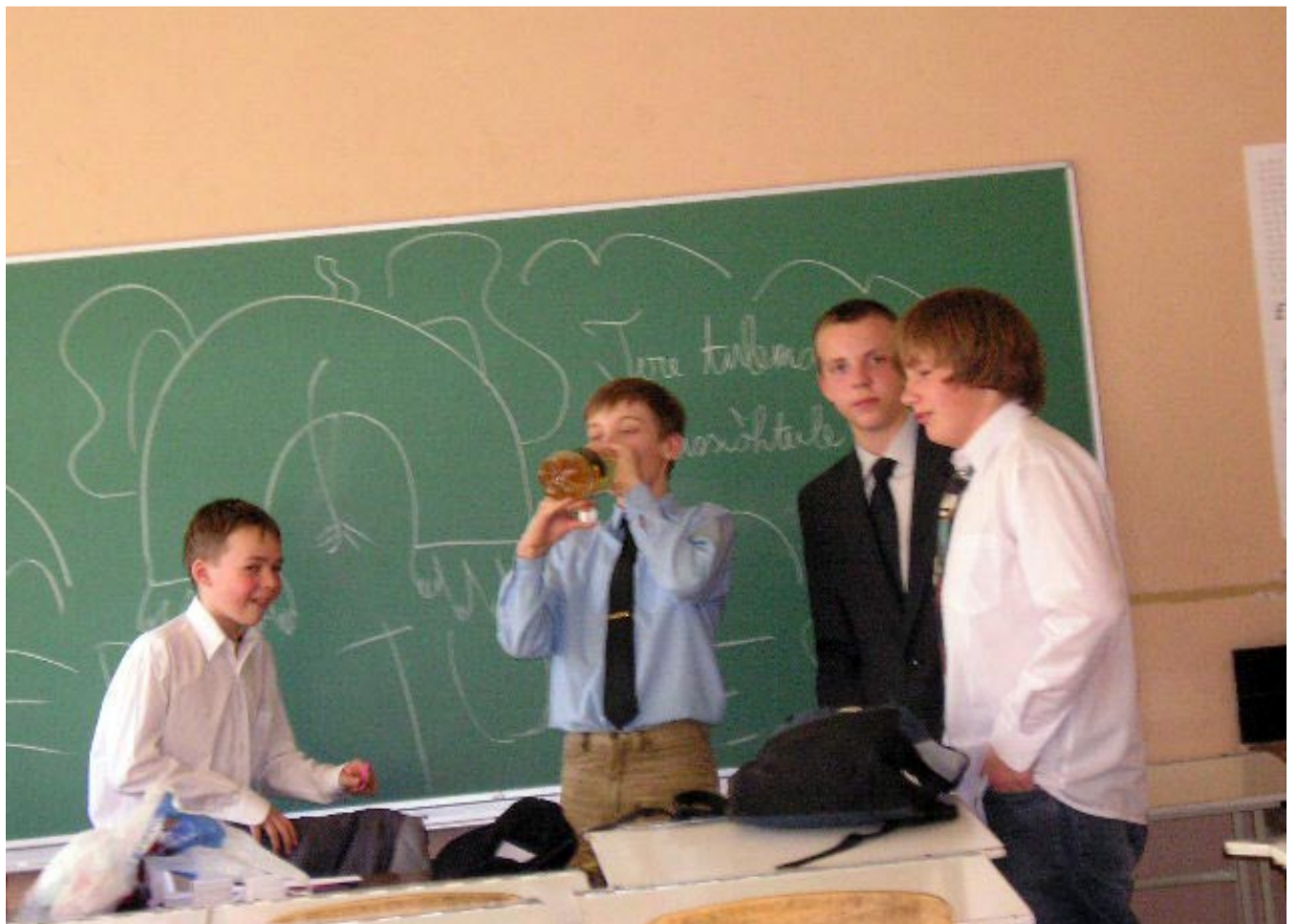
Need noormehed fotol on käitumise ja õppimisega olnud teistele eeskujuks! Hetk on tabatud klassiõhtult, sest vaba aja õige sisustamine on üks hea käitumise alus.

Alaealiste komisjon jätkab oma tegevust ka sel aastal. Lisaks mõjutusvahendite rakendamisele on ka tänava kavas erinevad laagrid ja väljasõidud nendele kõurikutele, kes ilmutavad juba olulist paranemist oma käitumises. Koostöös piirkonna noorsoopolitseinikega toimusid 2004. aastal mitmed õnnestunud väljasõidud ja linnalaagrid. Väga tahaks loota, et neis osalenud tänava komisjoni ette ei satu!