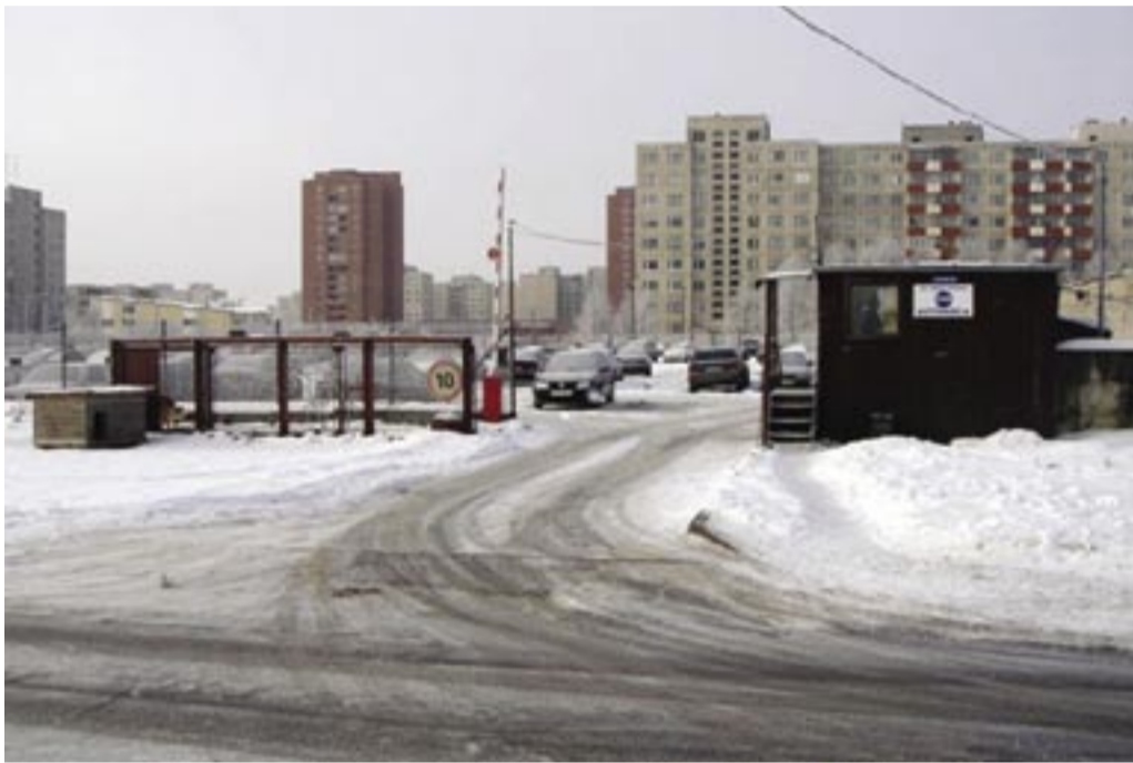
Vaade Härma 10 parklale.