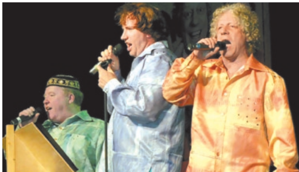
Ansambel Kuldne Trio (esineb 22. aprilli vabaõhukontserdil Lindakivi Kultuurikeskuse juures)

Kandideerimiseks tuleb esitada 30. aprilliks Tallinna Haridusametile kirjalik avaldus, asutuse lühitutvustus ja eneseanalüüs, lisaks võib esitada enesehinnangut illustreerivaid materjale. Auhinna võitjad kuulutatakse välja õppeaasta lõpus.