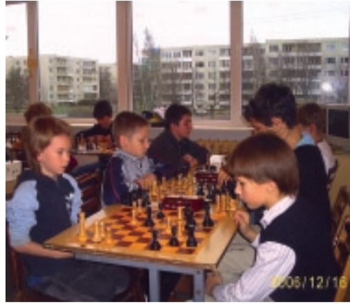
Noored maletajad võistlustules.

Eesti Maleliidu kalendris oleval 2006. aasta viimasel ametlikul noorteturniiril esinesid 81 noort malemängijat 18 klubist järgmistest kohtadest: Tallinn, Tartu, Pärnu, Kuressaare, Sillamäe, Haapsalu, Maardu, Kilingi-Nõmme ning Lagedilt/Sellist mastaapi turniir toimus meie klubis esmakordselt ning meil on hea meel, et vaatamata valmistumisele prognoositud kuni 60 malemängija vastuvõtuks, ARARAT CUP 2006 toimus edukalt ja isegi "suure varuga" ka nii suure osalejate arvuga. Ning peamine – ilma mingite märkusteta osalejate ja klubi esindajate poolt. Samuti on meeldiv märkida, et ARARAT CUP