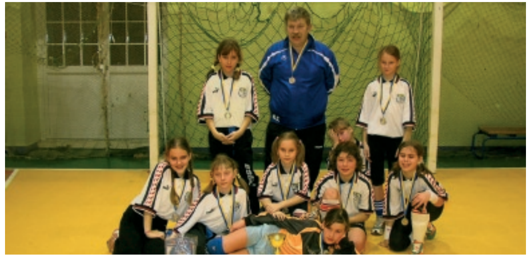
AJAX GIRLS CUP 2007 hõbedane võistkond FC AJAX Lasnamäe

13. jaanuaril toimus ajalooline esimene Tallinna regiooni tüdrukute (sündinud 1995 ja hiljem) jalgpalliturniir. FC AJAX Lasnamäe viis seda võistlust läbi oma võimlas Ajax-TLMK klubis.