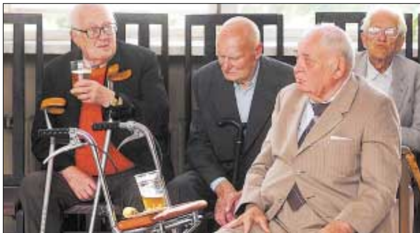
Iru hooldekodu elanikud maitsesid sünnipäeva puhul õlut.