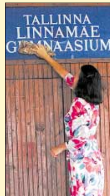
Uue sildi saab vastne lütseum sügiseks.