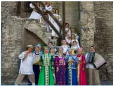
Lk.4 Ansambliil Zlatõje Gorõ on täitunud 15 aastat!