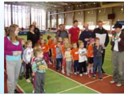
Lk. 4 Laste ja isade ühine spordipäev