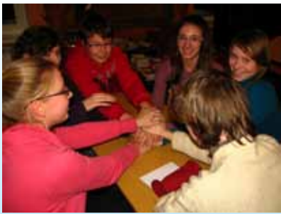
Лк.4 Кубок Ласнамяэ по игре «Что? Где? Когда?»