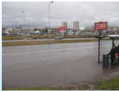
Лк.3 О безопасности на дорогах Ласнамяэ. Водители и пешеходы - будьте бдительны!