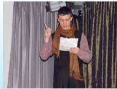
Лк. 4 Конкурс памяти Ф.М. Достоевского в Ласнамяэской русской гимназии