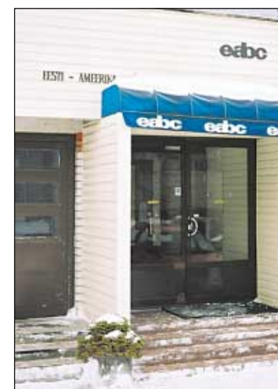
Kolledži sügavat sisu peidab tagasihoidlik fassaad.

Neile, kes soovivad iseseisvalt õppida, on kolledžis välja antud terve sari ettevõtlusalaseid õpikuid (oma firma asutamine, juhtimine, rahanduspoliitika jne). Jaanuaris lisanud neile "Tööõigus: eraettevõtja koolitus". Samuti võib kol-