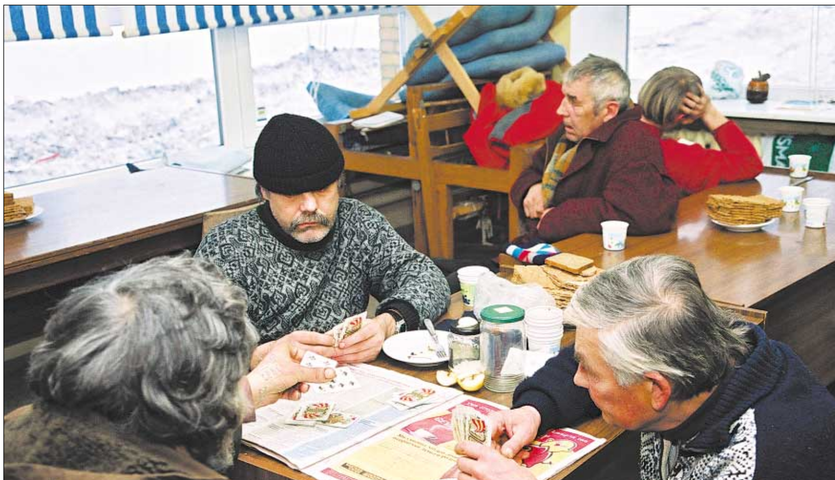
Päevaks keerati madratsid rulli ning kodutud sisustasid aega kaarte tagudes ja elu üle järele mõeldes.