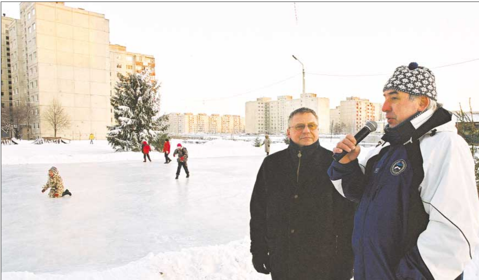
Olümpiavõitja Ants Antson leidis liuvälja avamisel, et uisutamise tegelemist takistab vaid vähene tahtmine.