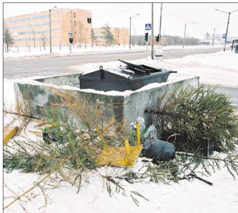
Jaanuari lõpus ei tohiks sellist pilti enam lasnamäelt leida, kuid elu on näidanud vastupidist.

GENNADI SOKOLOV, OÜ Almarino juhatuse liige