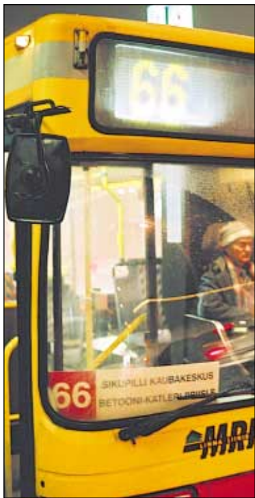
Esialgsetel andmetel on ringliin end õigustanud.