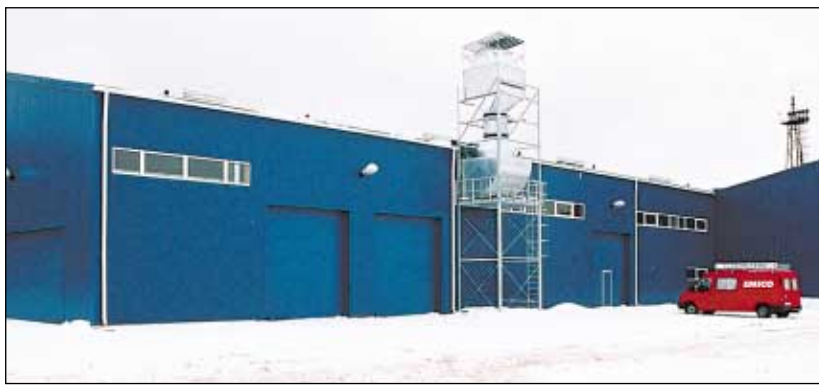
Vastne jäätmekäitlustehas ootab töölisi.

Tehas hakkab töötama seitse päeva nädalas kahes vahetuses. Palga arvestamine käib tunnitasa