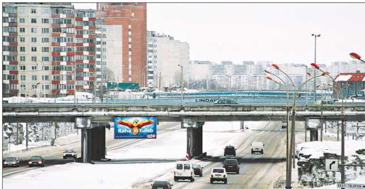
Laagna tee sillad ootavad värvi, nimesid ja infotahvleid.

Projekti järgi saavad lisaks värvile kõik sillad ka oma nime, mis tööde käigus sildadele peale märgitakse. Praeguseks värvitud sildadel on need olemas, kuid hädasti vajavad oma nime ehk mööda silda kulgeva tänava nimetust ka ülejäänud viis silda.