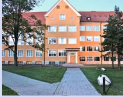
Tallinna Kunstigümnaasium LK 4