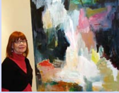
Salme Kultuurikeskuses oli võimalik korraga vaadata üheksa Soome kutselise kunstniku töid LK 2