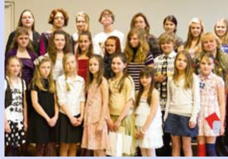
Põhja-Tallinna linnaosa lasteade ja koolide traditsiooniline lauluvõistlus SILLER 2011 LK 5