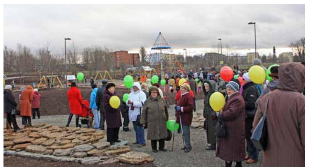
Suurel avamisüritusel oli näha igas vanuses inimesi.

talvel vabas õhus mitmel moel tasuta tervisesporti harrastada, aga ka perega kaunis looduslähedases keskkonnas vaba aega veeta – näiteks tiigi kaldal piknikut pidada. Vee äärde rajatud suveteatriplatsil saab ka kontserte ja vabaõhuüritusi korraldada. Pae parki endise paekivikarjääri alale on sportimisvõimalustega aktiivse puhkeala rajamist planeeritud juba aastakümneid. Seda nähti ette juba 1978. aasta paiku Lasnamäe elurajooni planeerides ning 1983. aastal koostati sellele pargialale ka detailplaneerimise projekt, mida omakorda 1992. ja 1994. aastatel muudeti. Pae puhkeala rajamine lisati ka Tallin-