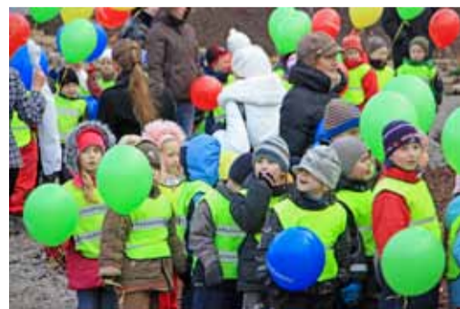
Ka mudilased olid uut parki uudistamas. Kindlasti saab värskest rajatud mänguväljakust nende uus mänguplats.

Linnapea Edgar Savisaar meenutas avamisel, et pole palju aega möödas sellest, kui seal vana paekarjääri ümber kasvas võsa ja hoolimatud inimesed tassisid sinna oma prügi. Veekogu ääres vedelesid aastaid tohutud betoonblokid ning koristustalgude käigus veeti sealt aastate jooksul minema tonnide viisi autorehve ja sadu kuupmeetreid prügi. Võsas ja tiigi kaldal vedelesid nii päevinäinud sohvad kui ka näiteks vana vannitoasisustus. Kord tõmmati sealt veest välja lausa neli roostetanud autovrakki. Sama tiigi kaldal on aga veelindude: külmnookluiked, tuttvartide, naerukajakate, laugude, sinikaelpartide, kalakajakate pesitsus- ja puhkekoht Kunagisele tühermaale, kus asub ka pae kaevandamise tulemusel tekkinud tehisveekogu, on nüüdseks rajatud mitmesuguseid vaba aja veetmise võimalusi pakkuv avar park. Puhkealal saab nii suvel kui