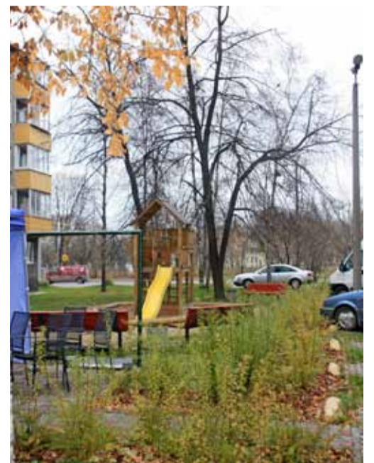
Esikoha saanud KÜ Peterburi tee 22 hoov. Projekti autor Jaana Soom, Mustamäe Haljastus AS.