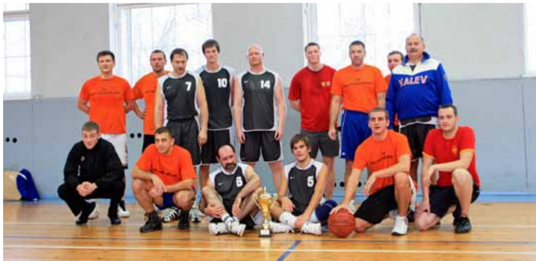
Korvpallurite grupipilt. Hallis kohtumise võitnud linnaosa valitsuse mängijad ning oranžis tugev vastane – politseijaoskonna meeskond.

Võistlus peeti Lasnamäe linnaosa vanema rändkarikale, mis seekord jääb aastaks kaunistama linnaosa valitsust ning loodetavasti kujuneb sellest pikk ning võitluslik traditsioon.