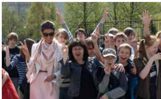
Skate-park, mida meie linnaosa noored kaua ootasid on jälle avatud Kivila pargis.