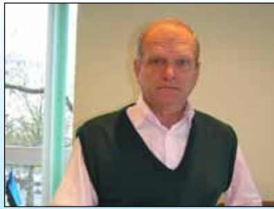
Lk4. Lasnamäe spordi- kompleksi eesotsas on maailma võrk- pallilegend