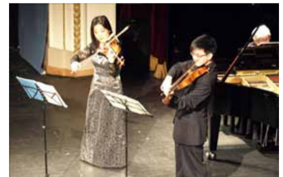
Klassikalise muusika kontsert silmapaistvate prantsuse muusikute esitluses kogus Vene Kultuurikeskuses täissaali!