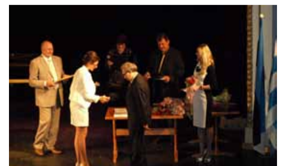
Lasnamäe tänumärke said need, kes on teinud ja teevad palju selleks, et meie linnaosa muutuks iga aastaga vaid paremaks.