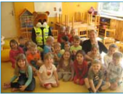
Lk2. Noorsoopolitsei ja Lõvi Leo lasteaias külas