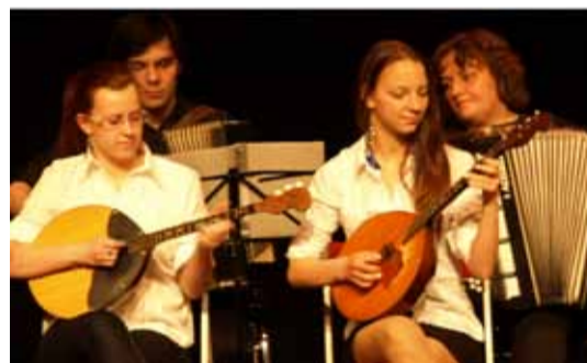
Lasnamäe koolide loominguliste kollektiivide kontserdi ajal näitasid osalejad, et meie linnaosa noored oskavad tantsida, laulda ja mängida rahvapillidel väga hästi.