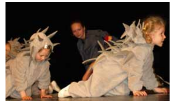
Kolmapäeval, 16. mail, astusid Lindakivi Keskuse lavale meie linnaosa kõige väiksemad artistid – need, kes veel käivad lasteaedades. Kõige noorem osaleja, kes esines siili tantsuga, oli vaid kaheaastane!