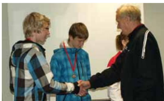
Orienteerumisvõistluse võitjaid õnnitles ning autasustas medalitega ja karikatega 1972. aasta kõrgushüppe olümpiavõitja Juri Tarmak.