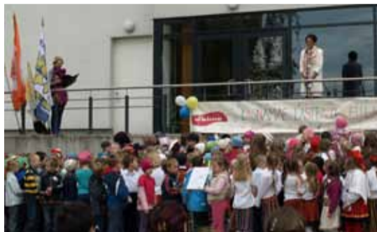
Mini-laulupidu toimus Lindakivi Kultuurikeskuse kõrval oleva väljakul. Kusjuures, mini ta oli mitte osalejate arvu poolest, vaid seetõttu, et erinevate lauludega esinenud osalejate vanus oli alates kolmest kuni seitsme aastani.