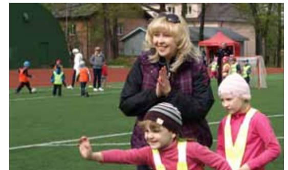
Traditsiooniline üritus „Ma oskan seda“ kutsus kokku Lasnamäe spordikompleksi staadionile umbes 500 osalejat 27 Lasnamäe lasteaiast. Lapsed tutvusid liikluseeskirjade alustega, mängisid jalgpalli, said teada, kuidas helistada päästeteenistusse jne.