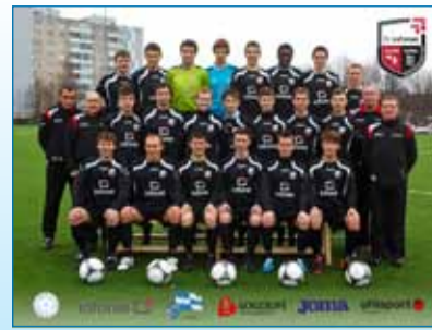
Lk3. FC Infonet pürgib Meistrite liigasse.