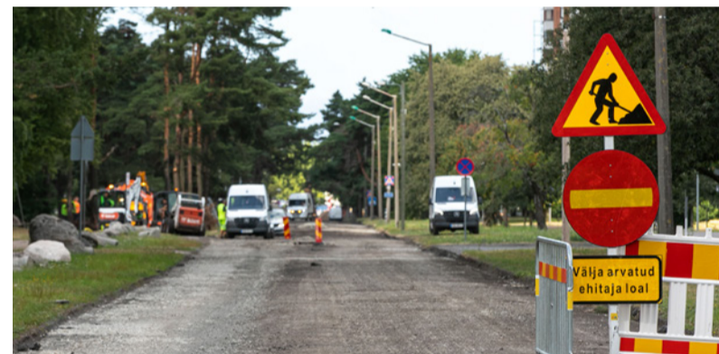
Объект планируется завершить в мае 2022 года. Илья Матусихис

Из-за ремонтных работ также изменится и маршрут автобусной линии номер 66 (направление Пельгуранд - Прийсле). До 12 сентября маршрут не будет проходить по бульвару Кольде, не будет остановки «Хельме». В этот период автобусы маршрута 66 будут следовать с ул. Пельгулинна на ул. Сыле по ул. Пухангу, остановка «Супельранна» будет делаться на ул. Пухангу (обычно она выполняется на ул. Пельгуранна). Дополнительные остановки на ул. Пухангу: «Вихури» и «Пухангу», на ул. Сыле: «Эхте» и «Нису». Длина реконструируемого участка дороги составляет 1,3 км. Срок сдачи объекта – май 2022 года. Всем участникам движения необходимо следить за временными дорожными схемами и знаками.