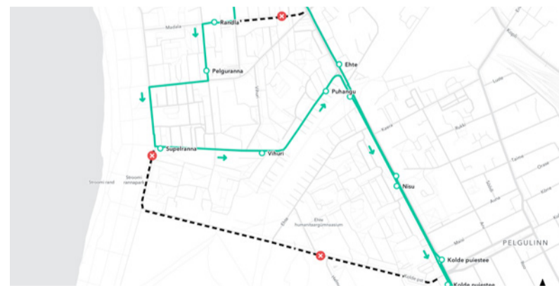
Маршрут автобуса номер 66 на время работ.