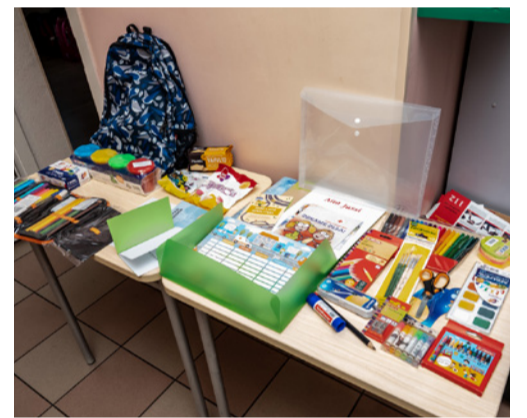
Кампания поможет 60 детям из Пыхья-Таллинна. Матс Блун

В рамках кампании «Ранец 2021» будет оказана помощь 408 школьникам, 60 из которых – из Пыхья-Таллинна. Кампанию «Ранец 2021» организует Таллиннское общество Красного креста Эстонии, город оказывает финансовую поддержку комплектации 408 ранцев. Списки нуждающихся семей были составлены в сотрудничестве с работниками таллиннских районных отделов соцобеспечения.