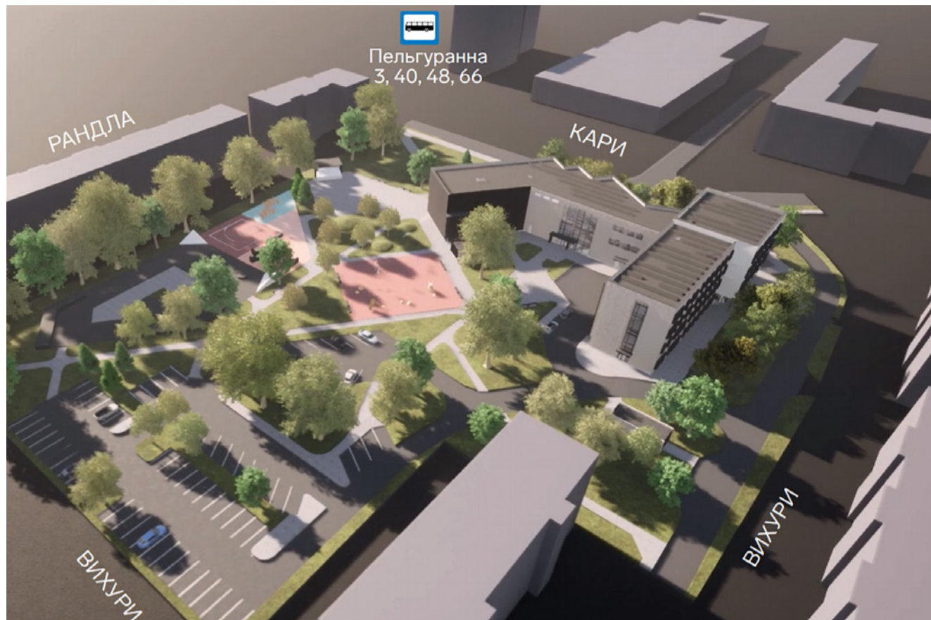
Управа Пыхья-Таллинна начнет работу на Кари, 13 с 6 сентября.

Новый общественный центр по адресу Кари, 13 будет завершен к сентябрю. В здание переедет управа Пыхья-Таллинн, Коплиская школа по интересам, региональный опорный пункт МуПо, начнут работать кафе-столовая и некоммерческие объединения. Наконец-то жители Пыхья-Таллинна смогут получить все услуги в одном здании, где, помимо решения административных вопросов, можно будет просто отдохнуть и попить кофе.