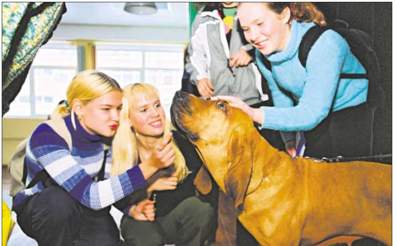
Lasnamäe Gümnaasiumi õpilaste lemmikuks politseipäeval kujunes narkokeer.