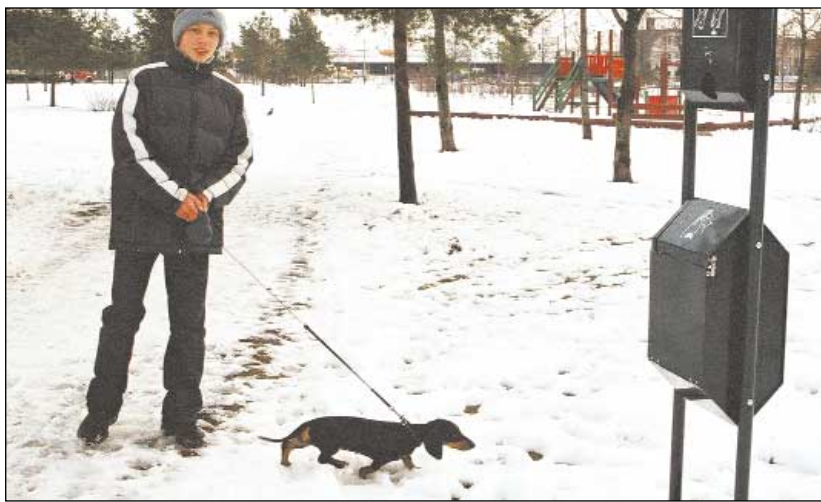
Selle taksi kaka pistis omanik piltniku nähes ruttu prügikasti.

Samas on mitmed linnaosavalitsuse töötajad tänavatel kuulnud elanike märkusi hooletutele koera-