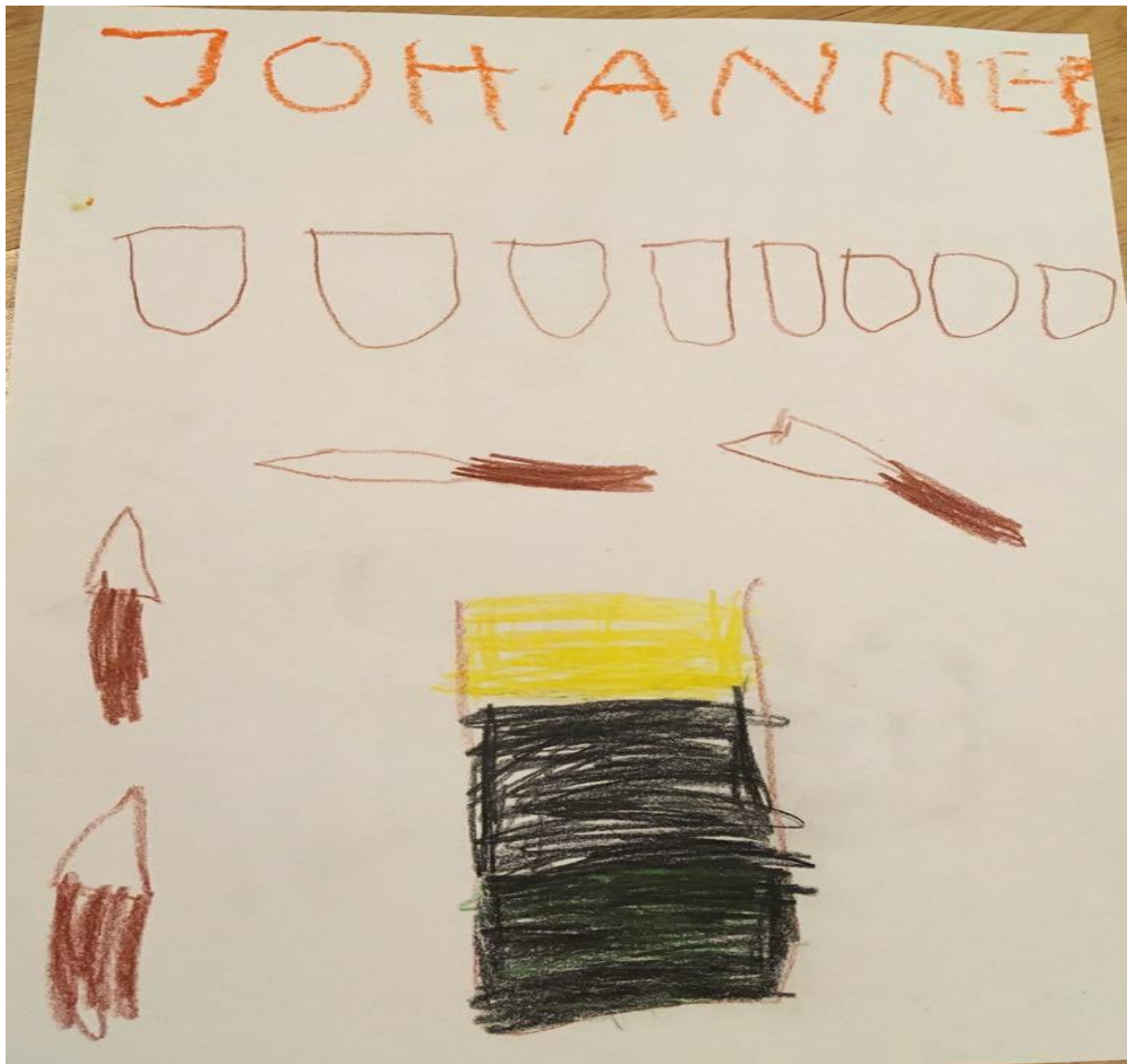
„Pipetid, tühjad topsid, anum värvilise veega, mille pinnal on õli.”