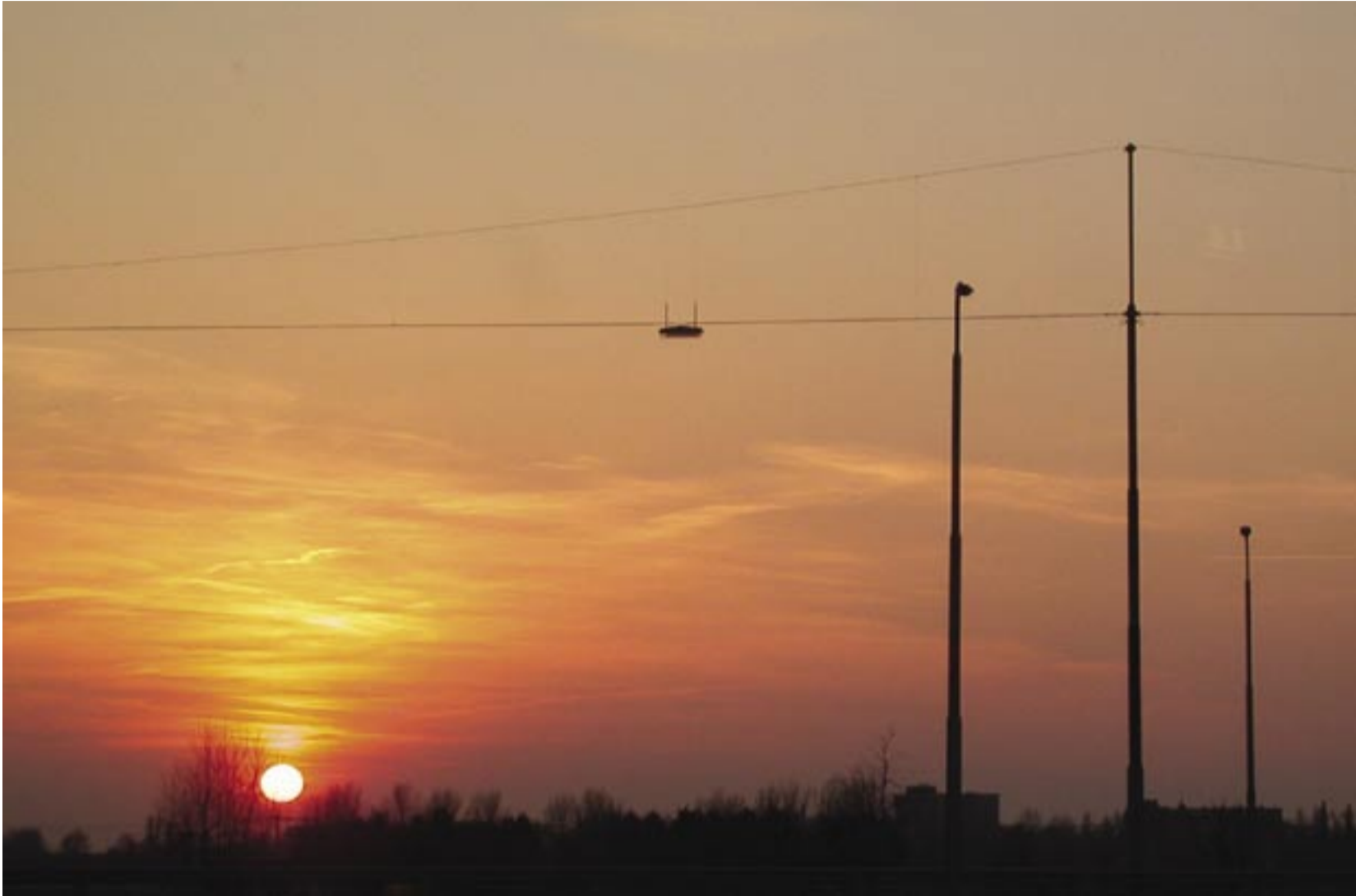
Uuele päevale vastu...