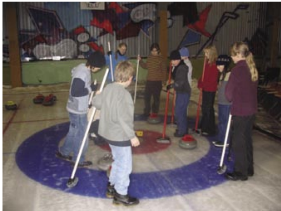
Noored katsuvad jõudu curlingus

Oli pikk ja vahva nädal. Toredate üritused aga Lasnamäe ANKis jätkuvad, tuleb olla tähelepanelik ning jälgida reklaami. Varsti valmib ka kodulehekülg!