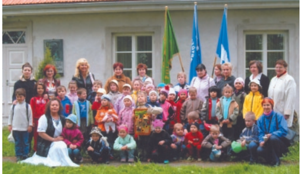
Nüüdsest on Lindatütardel ja Kalevipoegadel oma lipp, mille alla koonduda ja mille toel olulisel sündmusel tähistada. (Foto noorteorganisatsiooni fotoarhiivist, 28.05.06.)

nendele, kes on julged, vaprad ja oma unistuse – elada vabana vabal maal – suutnud ellu viia. Võidupühäl süüdatakse lõkkes üle Eestimaa. See on mälestuste ja lootuste tuli, mille paistel peetakse kõnesid, lauldakse, tantsitakse kootuses, et Eesti Vabariik on iseseisev ja et siin on turvaline ja hea