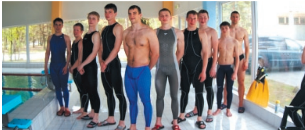
Parimad Fortuna meeste- ja noorteklassi allveeujujad Eesti meistrivõistlustel 14. mail 2006 Nõmme ujulas

Selle tõestuseks on fakt, et tänase Eesti allveeliidu organisatsioon loodi 1950-ndate lõpus. Juba tegevuse algusaastatel näidati head taset ka Rahvusvahelise Allveespordi Föderatsiooni (CMAS)