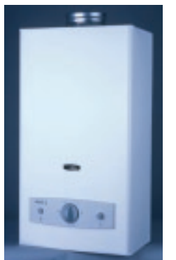
Näide kaasaegsest ja ohutust gaasiahjust.

dunud ise Tehnokontrolli keskuse poole palvega teha nii gaasitorustiku kui ka majas asuvate gaasiseadmete kontroll. See on otstarbekas, sest siis on ühistu juhatusel selge ülevaade gaasiseadmete seisundist majas ja ka korteriomaniik on muret vähem. Lisaks sellele on kohalikud omavalitsused toetanud vanade gaasiseadmete väljavahetamist. Gaasi hind õige lepinguga oluliselt madalam Korteriühistutel on otstarbekas pöörduda ise Tehnokontrolli keskuse poole palvega teha nii gaasitorustiku kui ka majas asuvate gaasiseadmete kontroll ning hakata Eesti Gaasiga arveldama majas tarbitava gaasi eest ühiselt.