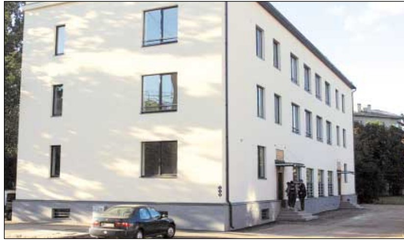
Pae 48 plahvatas kolm aastat tagasi pomm ja sellest ajast seisid maja tühjana.

Igale korteriomanikul on keldriboks, samuti saavad elanikud kasutada sauna ja puhkeruumi. Korterite