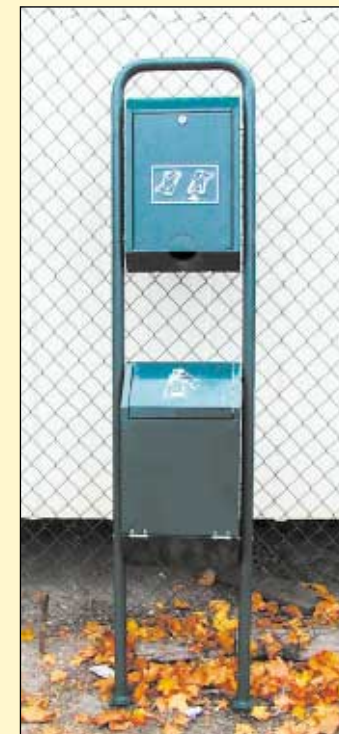
Kümme Lasnamäe haljasaala saavad sellised koerakakastid.