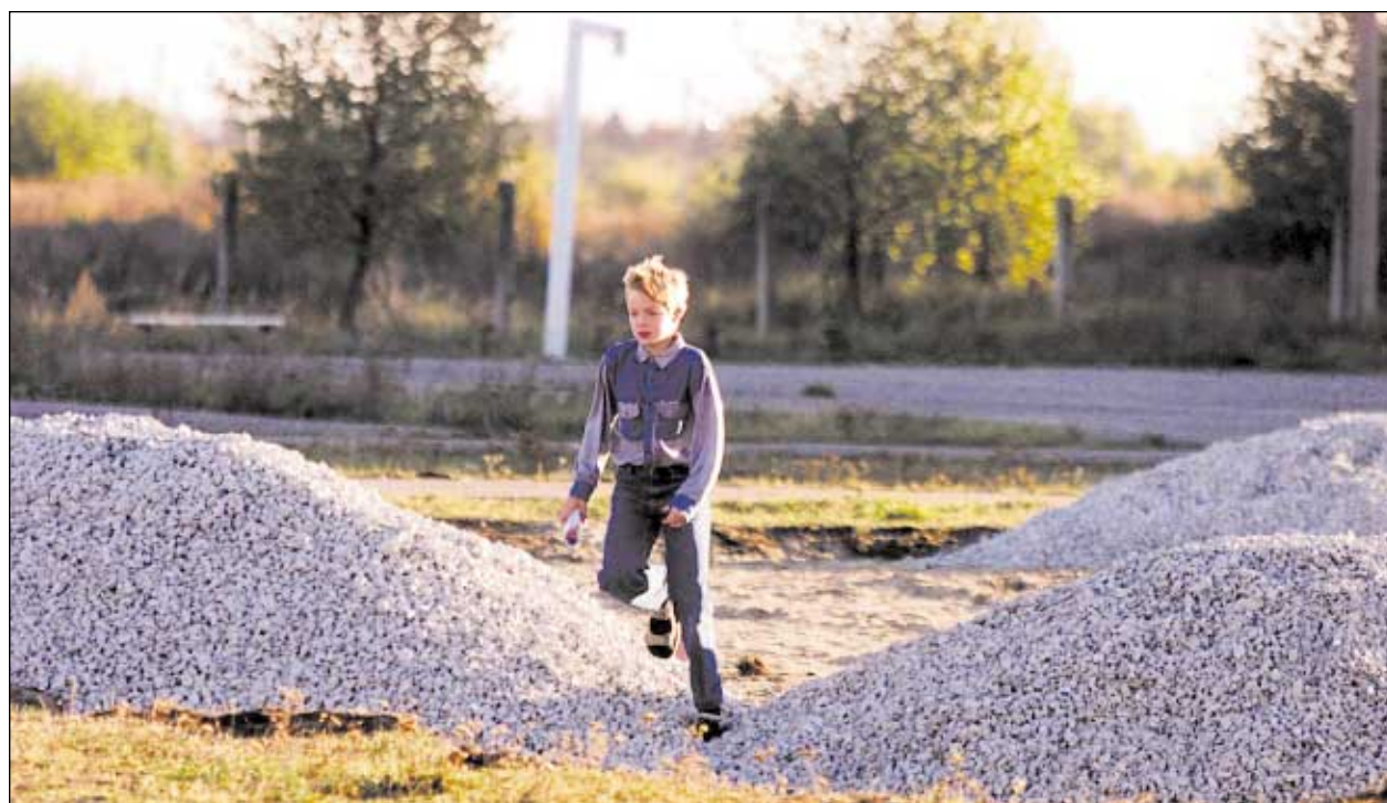
Pildi tegemise ajal olid praegusel palliplatsil vaid killustikuhunnikud.

Kärberi tänaval on nüüdsest võimalik mängida käsipalli igati nõuetekohasel platsil, sest oktoobri keskel valmib seal võrkaiaga piiratud õiges mõõdus mänguväljak.