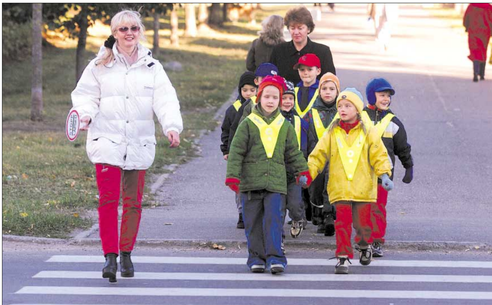
Esimeste seas said linnaosalt helkurkraed kätte lasteaias "Rukkilill" kasvandikud.