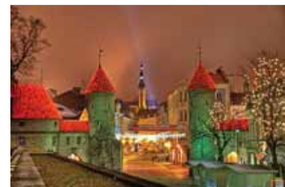
Parima foto "Võluv öine Tallinn", autor Aleksei Rokaševič.

Fotokonkursi "Parim jõulukaunistusfoto" võitjate autasutamine toimus Kadrioru pargi muuseumis, Weizenbergi 26, kus sai tutvuda ka kõigi konkursile esitatud töödega.