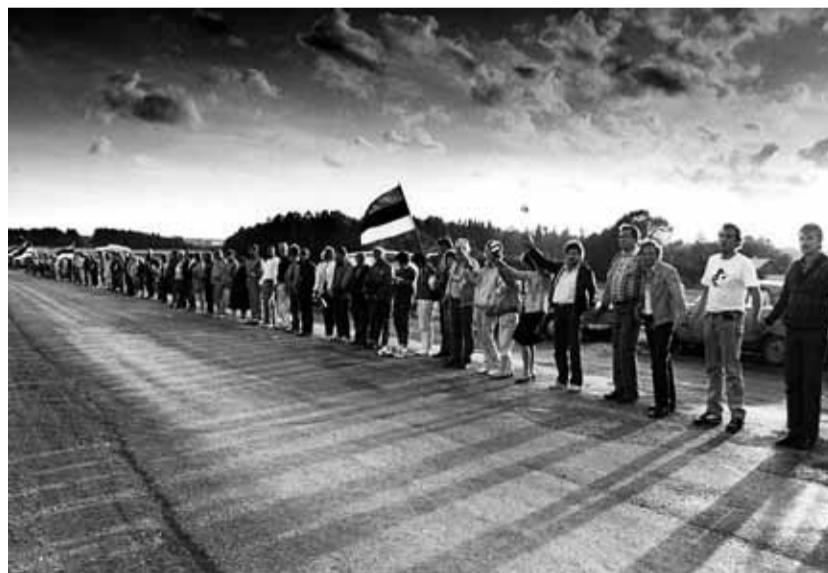
Balti kett 23, august 1989.

Tallinna Linnavalitsuse korraldusega kuulutatakse välja avalik konkurss Balti keti 20. aastapäeva märkivate ning ärkamisaja temaatikat käsitlevate filmide ideekavanditele.