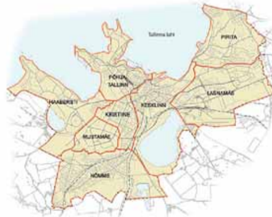
Selline on Tallinna administratiivjaotus täna. Poole aasta pärast on see oluliselt muutunud, sisaldades 10 piirkonda ja enam kui 30 ajalooliselt väljakujunenud asumit.

Kui haldusreformi elluviimise tulemusel suureneb Keskerakonnale antavate häälte arv Tallinnas, on see igati loogiline. Linlastel tekib hea võrdlusmoment – kes vaid räägib muutustest, kes suudab neid ka ellu viia! ■