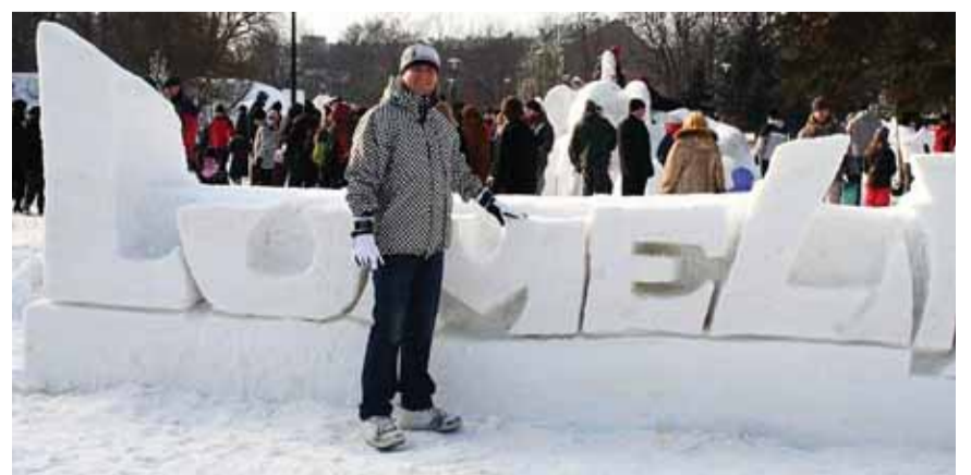
On tõesti tore talv. Nii lumelinna meistritele kui lumelinna organisatoritele. Tulge ja veenduge ise.

Mõisa sõnul leiab ta, et linna piirid tuleks määrata inimeste liikumise järgi – suurem osa Tallinna lähivaldade elanikest käib ju töö linnas.