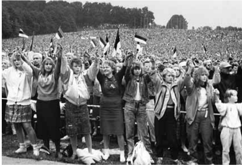
Kui kõik oli alles ees. Fotomeenus 1988. aastast.

Ajalugu on meile õpetanud, et väikeriigi isolemine võib olla habras. Eesti riiklus taastati vabadust armastavate inimeste poolt. Laulev revolutsioon ja unistus oma riigist ühendas eesti rahva nii, nagu seda varem ega hiljem pole olnud. Vaba ühiskonna kaitsmine on Eesti riikluse kaitsmine ja iga tegevus, mis aitab omariiklust tugevdada, on investering tulevikku.