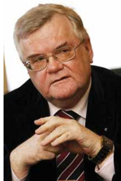
Linnapea Edgar Savisaar käis välja hättasattunud kaaskodanike abistamise kava.

Euroopa omavalitsusühendused on olnud kohad, kus saab käia lähetustes ja suhelda kolleegidega. Nüüd on aga käes aeg Euroopas ühist asja ajada. Me peame