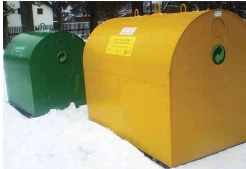
Tallinnasse on aasta algusest alates lisandunud üle 80 uue pakendikonteineri.

Pakendikonteinerisse on lubatud tuua ainult puhtad ja eelnevalt sorteeritud pakendijäätmed. Suuremahulised pakendid (näiteks plastist joogivee kanistrid jms) peavad olema enne konteinerisse panemist kokku surutud. Jäätmete ladustamine konteineri kõrvale on keelatud.