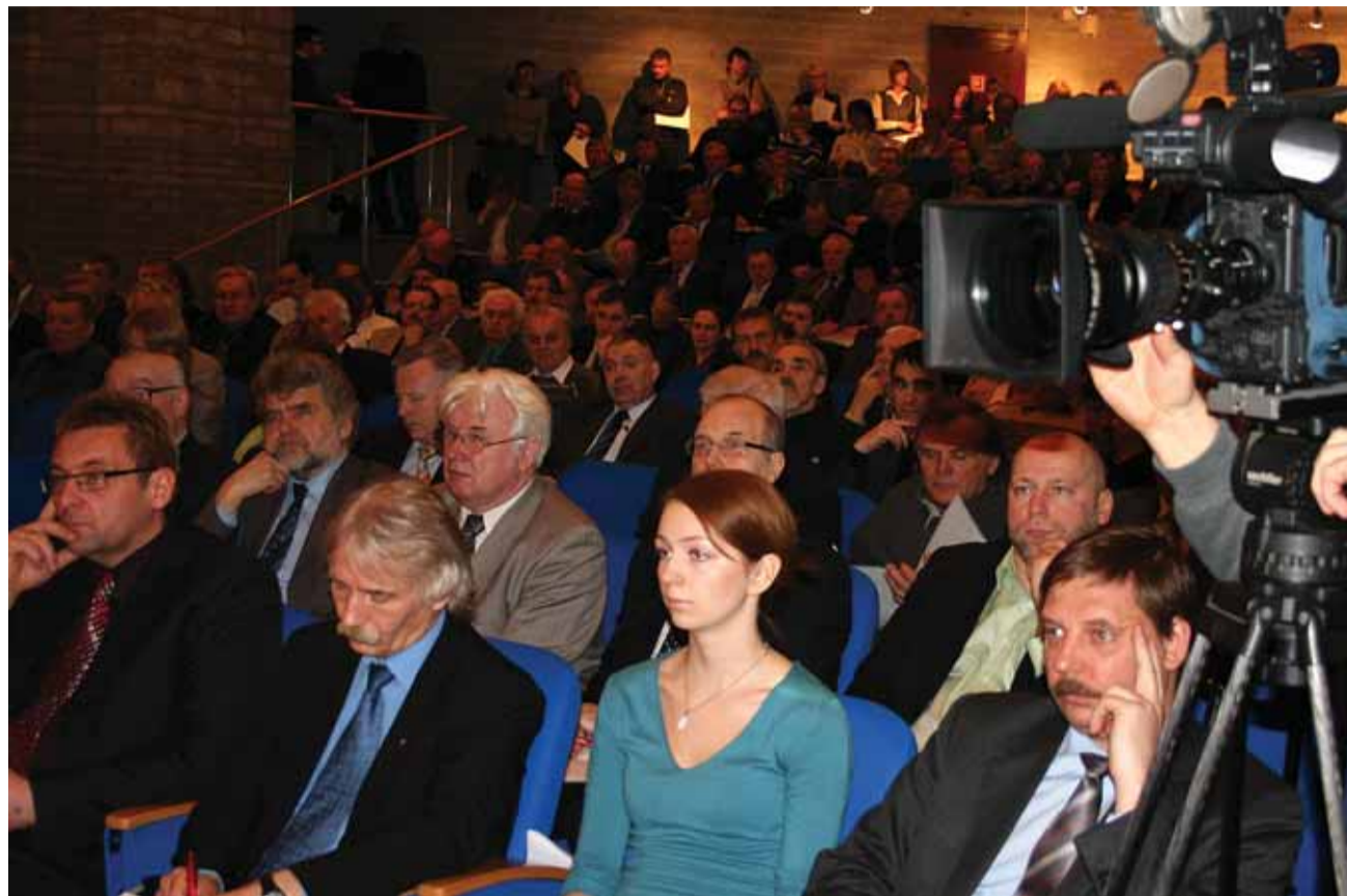
12. märtsil omavalitsustegelaste foorumile kogunenud kuulajad tähelepanuga Tallinna linnapea Edgar Savisaare ettekannet “Valitsuse kärpekava kui põhiseadusevastane dokument”.

EL-i mittekooluvas Norras on omavalitsusliit pöördunud parlamendi poole palvega tösta omavalitsustele minevaid makse ning vastavalt vähendada riigile minevaid makse, et kindlustada omavalitsuste sissetulekuid tänava aastal. Valitsus ongi lubanud garanteerida 2009. aastal omavalitsussektori tulubaasi säilimise. Valitsuse majanduse stimuleerimise pakettis oli ka 2 miljardit norra krooni omavalitsussektorile, kompenseerimaks eeldatavat tulumaksulaekumise langust.