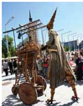
Meenutus eelmise suve tänavatendusest.

Tallinn Treff Festival toob kultuuripealinna teatrimaailma suurnimed ja kireva tänavaprogrammi.