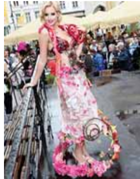
Lilleballi glamuurne ilu.

Tallinna Lilleballi oma pikaajagete traditsioonide ja väljakujunenud pealtvaatajakonnaga leiab endale kahtlemata vanalinna päevadel väärilise koha.