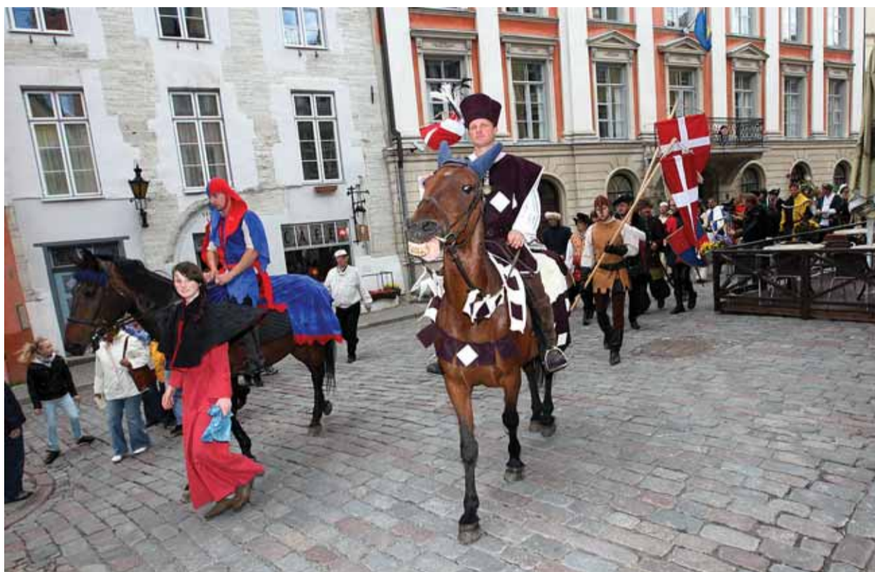
Vanalinna päevad on aasta vaatamängulisim sündmus.