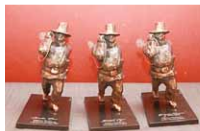
Tunnustusauhind "Rõõmus korstnapühkija".

Aasta väljapaistvaima teo auhind omistatakse isikule või isikute grupile või juriidilisele isikule, kes on algatanud heatege-