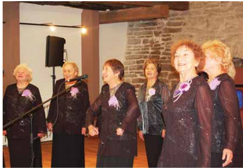
Ansambel Miraaž eakatepäeva kontserdil Hopneri majas.

Päeva jooksul hakkas ka kõht endast vaikselt märku andma, millele oli ka mõeldud... Sotsiaalkeskuse vahvad naised köögist olid valmistanud tervisliku lõuna, mis oli ka taskukohane kõigile. Tublit köögirahvast tuleks küll lausa eraldi kiita. Nad on töökas ja rõõmus personal, keda tuleks tänada nii juba tehtu kui ka eesootavate tegemiste eest! Maja kõigis suurematel ja pidulikumatel üritustel on nad agard kaasalööjad. Hiljutine hea mälestus ongi eakate päeva tähistamisest Hopneri majas (end Matkamaja).