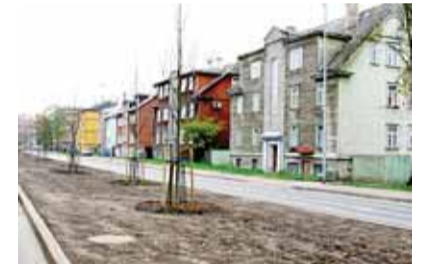
Juured kindlalt mullas.

Oktoobri alguses uuendati K. Tümpu tänava allee, mis koosneb 18 noorest läänepärnast.