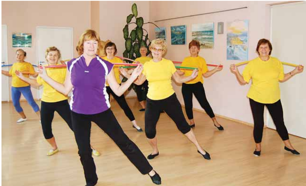
Kesklinna sotsiaalkeskuse võimlejad ei kurda väsimuse üle.

Väljaandja Tallinna Kesklinna Valitsus Trükki toimetanud OÜ Meedium Reklaam tel: 660 1641 e-post: reklaam@ajakirjyks.ee