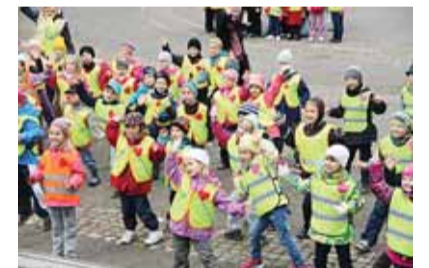
Tervisepäeval oli lõbus.

Tornide väljakul toimus Kesklinna lasteadeade tervisepäev "Liigume mõnuga".