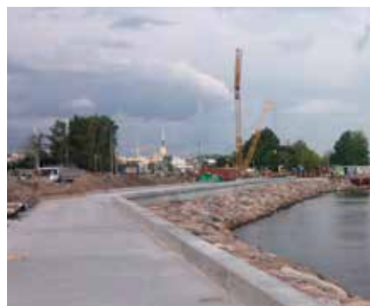
Смотрите стр. 2 Улица Рейди строится