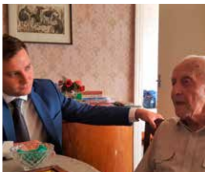
Смотрите стр. 2 105-летний таллинец

Источник: Регистр народонаселения, 1 сентября 2019 г.