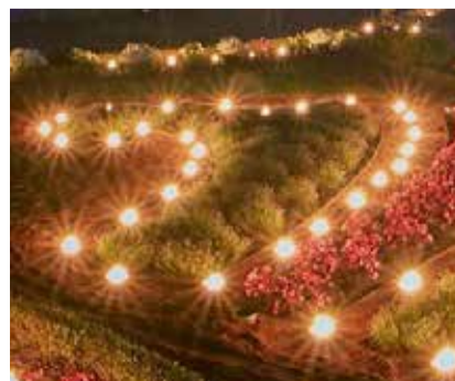
Смотрите стр. 3 Фестиваль света