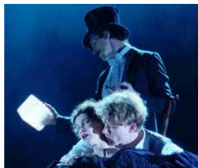
Смотрите стр. 4 «Золотая маска»

Следующий номер газеты Kesklinn Sõnumid выйдет 9 октября.