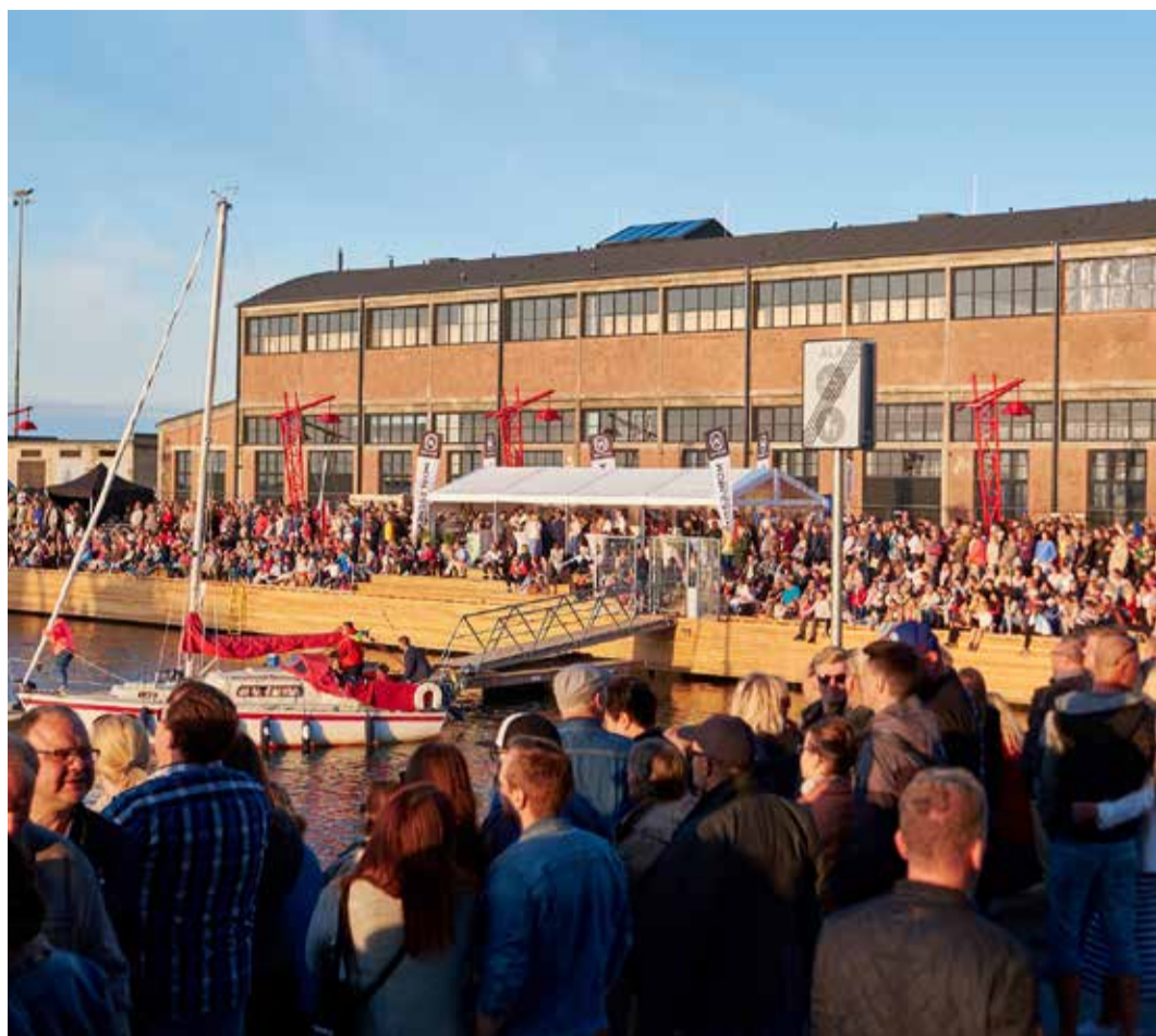
Центр искусств Kai во время Дней моря.