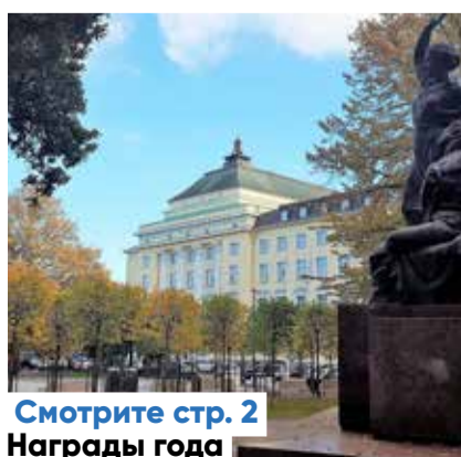
Смотрите стр. 2 Награды года

Источник: Регистр народонаселения, 1 марта 2019 года.