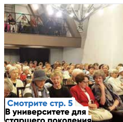
Смотрите стр. 5 В университете для старшего поколения

Следующий номер газеты Keskklinna Sõnumid выйдет 10 апреля.