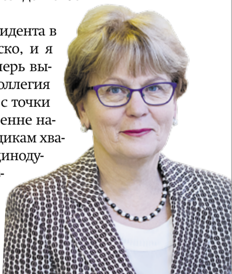
Хелле Калда Старейшина района Мустамяэ