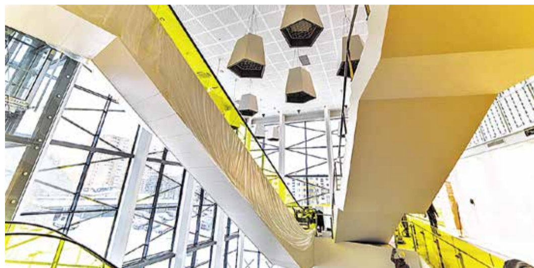
... и в начале января 2016