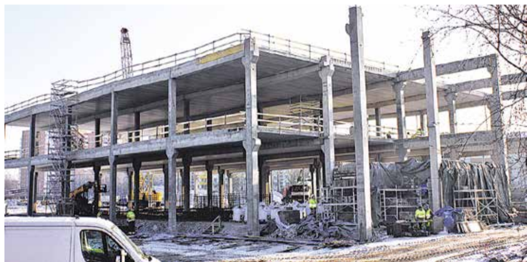
Mustamäe Keskus в начале февраля 2015...