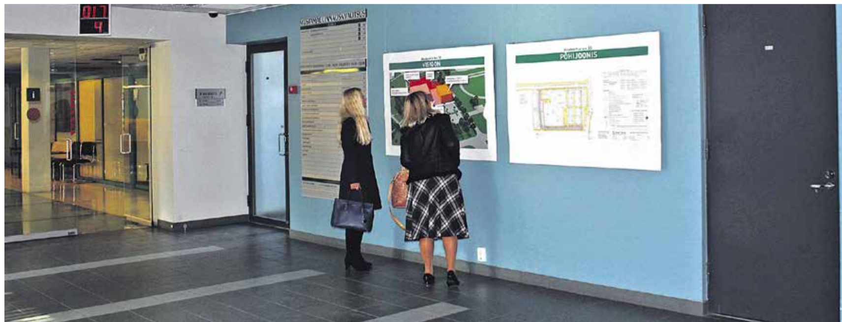
На выставке, открытой в фойе Управы района Мустамяэ, можно было познакомиться с видением, горизонтальной проекцией и схемой движения детальной планировки «Akadeemia tee 30».

Отвоз заполненных лиственной мешков на мусорную свалку организуем мы. Заполненные лиственной мешки просим складывать в место, удобное для подъезда грузовой машины. О заполненных мешках сообщите по тел. 645 7526 или 645 7500, либо по э-почте urmas.kopp@tallinnlv.ee .