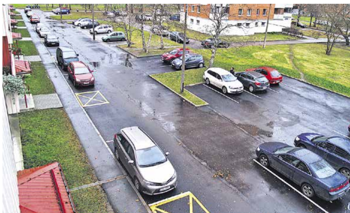
Мустамяэские квартирные товарищества, успешно участвовавшие в проекте «Дворы в порядок»: бул. Сыпрузе, 196 и 194; Вильде тез, 98 и А.Х. Таммсааре, 69.

Следующий круглый стол планируется провести 17 февраля в форме нового мероприятия, затрагивающего новые темы.