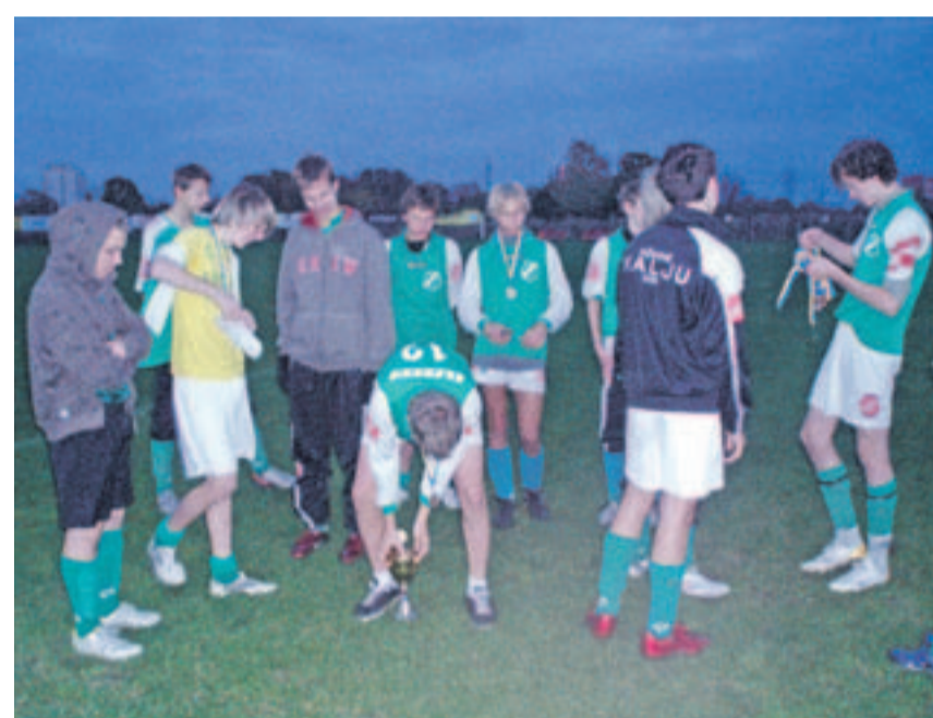
Nõmme JK Kalju 1992. a. sündinud poiste võistkond pärast Ajaxi- turniiri. Poisid on väsinud, aga rahulevad.

Noortetöö uuendusena on treeninggruppidel nii põhitreener kui ka asendustreener, et vältida treening-