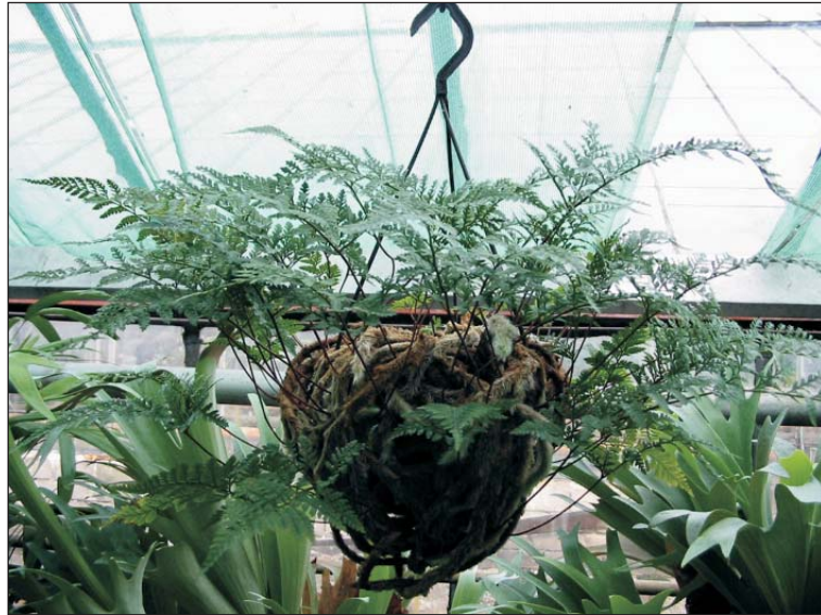
Urmas Laansoo Näituse kuraator

Üldinfot saate telefonilt 6 062 666; koduleheküljelt: www.tba.ee