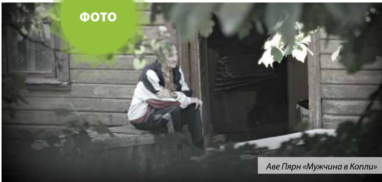
Аве Пярн «Мужчина в Копли»