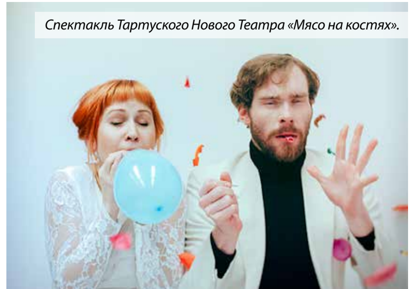
Спектакль Тартуского Нового Театра «Мясо на костях».