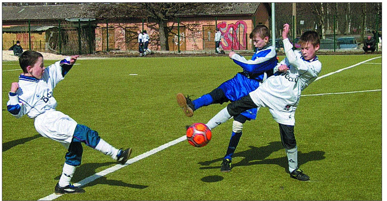
Haabersti linnaosa noormehed mängivad vabal ajal meelsasti jalgpalli.