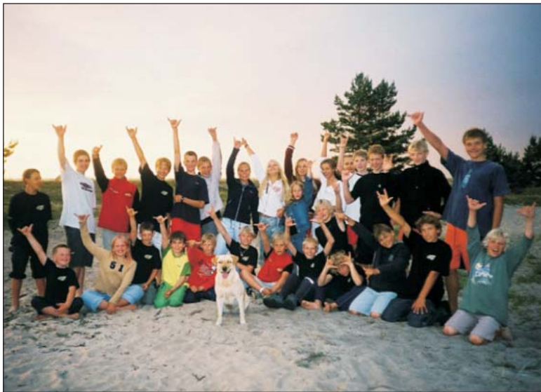
Hawaii Expressi Purjelauakool Nõva surfilaagris 2003