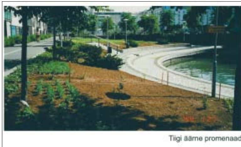
Tiigi ääme promenaad

Igapäevaseimate muudatustena nähakse ette asfaltkolmnurkade kujundamine linnaosavalitsusele (ühel juhul taastatakse ka vana hea liiklusväljak) ning erinevas vanuses lastele kolme suure mänguväljaku rajamise tii-