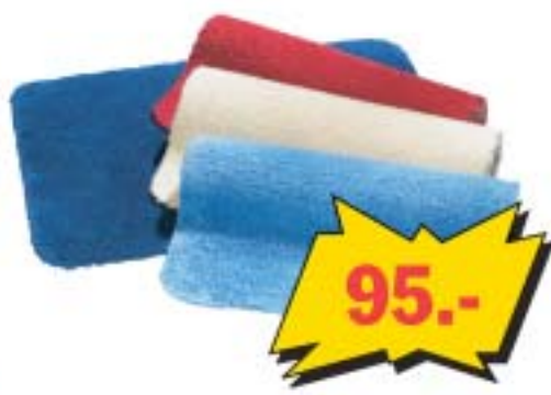
Puuvillane vannitoavärv 50x70 cm, tumesinine, helesinine, punane ja naturaalne valge.

K-rautakesko kauplused avatud: Haaberstis E-R 8.00-20.00, L, P 10.00-16.00; Lasnamäel E-R 8.00-19.00, L, P 10.00-16.00; Tartus E-R 8.00-19.00, L 9.00-16.00, P 10.00-15.00; Pärnus E-R 8.00-19.00, L 10.00-16.00, P 10.00-14.00 • Infotelefon: Haaberstis 674 7900, Lasnamäel 605 0200, Tartus 739 0800, Pärnus 447 0850. Pildidel on illustreeriv tähendus.