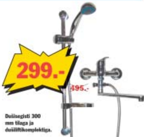
Düüsiest 300 mm blaga ja duššifitseeritud komplektiga.