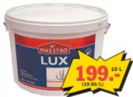
Kirgavvalge ja hea kattevõimega täismatt laevärv MAESTRO LUX sisetöödeks.