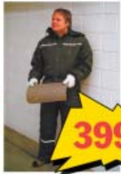
Klassikaline hekkribadega talvine töökombinesoon. Kombinesoonil on kapuuts ja lukuga taskud. 100% polüester, vooder 100% nailon.