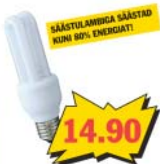
Säästulamp 11 W E27 2U. Annab sama palju valgust nagu 60 W taveline hõõglamp!