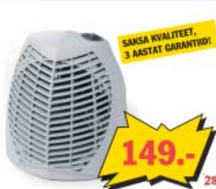
Termostaadiga puhur Clima 320TS 0/1000/2000 W. Anti-frost funktsioon ei lase ruumi temperatuuril langeda alla 5 kraadi.