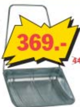
Kerge ja magav bingitud lumelabik, 800x610 mm. Kogupikkus 1400 mm, kaal 6,4 kg.