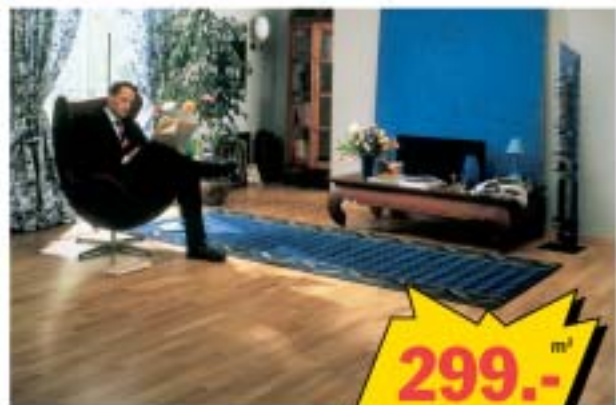
Naturaalne parkett 14 mm, tamm ristik.