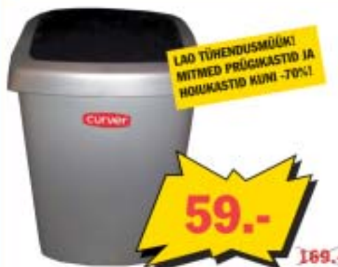
Hall sissetükatava kaanega 25 L prügikast.