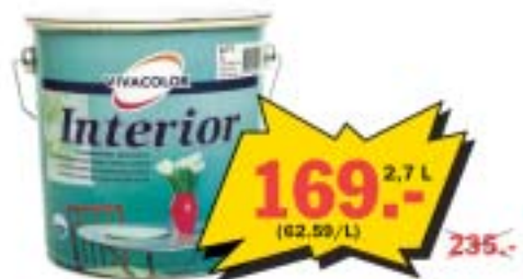
Valge poolmatt toonitav vesialusel akrilaalvärv INTERIOR seintele ja tagedele niisketes või suure kulumiskõõmusega ruumides (kõõk, koridor, treppikoda, vannituba). Kulu 8-10 m 2 /L.