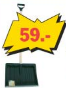
Metallserva plastmassist lumelabidas, laius 40 cm. Puitvars ja plastkäepide.

Pakkumised kehtivad 13.-31. jaanuarini 2005 või kuni kaup jätkub.