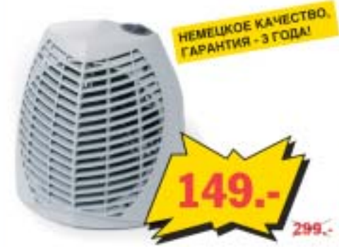
Обогреватель Clima 320TS с термостатом, 0/1000/2000 Вт. Функция anti-frost не позволяет температуре внутри помещения упасть ниже 5 °C.