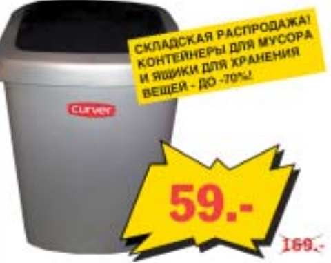
Контейнер для мусора, серый, 25 л, с вращающейся крышкой.