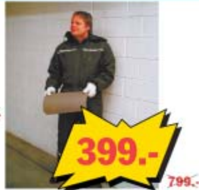
Классический зимний рабочий комбинезон. Светоотражающие полосы, капюшон, карманы на молниях, 100% полиэстер, подкладка - 100% нейлон.