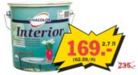
Белая, полуматовая, тонируемая акриловая краска на водной основе INTERIOR. Для стен и потолков во влажных или интенсивно используемых помещениях (кухня, коридор, ванная, подвезд). Расход: 8 - 10 м 2 /л.