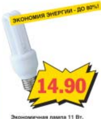
Экономичная лампа 11 Вт, E27 2U. Освещает, как лампа накаливания в 60 Вт.