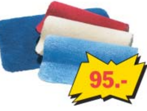
Коврики для ванной, 50x70 см, хлопок. Телно-синие, голубые, красные и натурально-белые.

Магазины K-rautakesko открыты: в Хааберсти: Пн. - Пт.: 8-20, Сб. - Вс.: 10-16, в Ласнамеа: Пн. - Пт.: 8-19, Сб. - Вс.: 10-16; в Тарту: Пн. - Пт.: 8-19, Сб.: 9-16, Вс.: 10-15; в Перну: Пн. - Пт.: 8-19, Сб.: 10-16, Вс.: 10-14. Телефон для справок: в Хааберсти: 674 7900; в Ласнамеа: 605 0200; в Тарту: 739 0800; в Перну: 447 0850. Фотографии носят иллюстрационный характер.