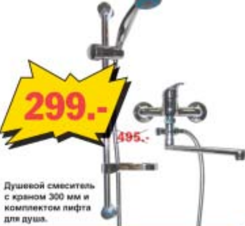
Душевой смеситель с краном 300 мм и комплектом пифа для душа.