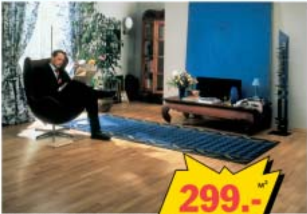
Натуральный паркет, толщина 14 мм, дуб "рустик".