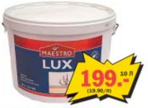
Ярко-белая матовая потолочная краска MAESTRO LUX, хорошо ложится на поверхность.