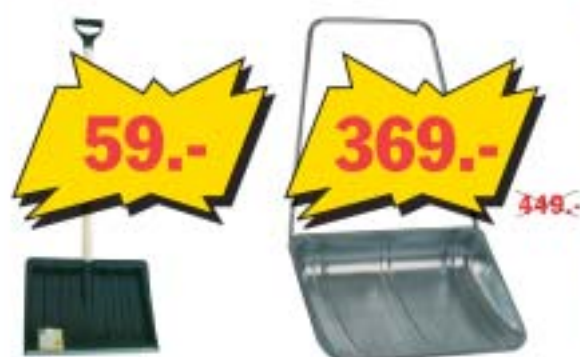
Пластиковая поганка для уборки снега, металлическая кромка, ширина 40 см. Деревянный черенок, пластиковая ручка.

Предложение действительно с 13 по 31 января или пока есть товар.