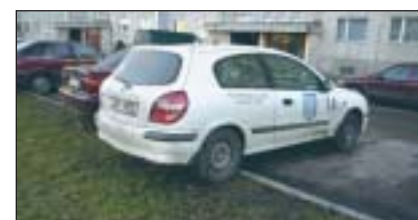
Tüüpiline murule parkimine.