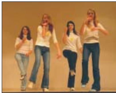
Kava nimega "Lollakad sidrunid" – 8b klassi õpilased, "Amatöörid" – 10a klassi õpilased (vasakul), ja "Hey Mickey!" – 10a klassi õpilased (all).