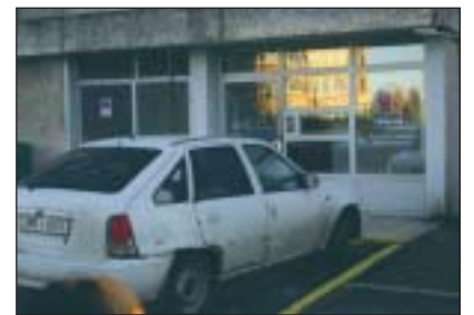
Sellele autojuhile ei tähenda kollane joon midagi...