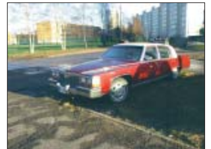
...ja see autojuht pargib oma auto lausa kõiki jalgu pidi murule.

lest summast 2/3, oleks ühistutel suisa rumal see võimalus kasutamata jätta", sõnas ta. Paljude majade juures, kus piisab vaid parkimisala laiendamisest, saab Rõivase sõnul parkimiskoha veelligi odavamalt kätte. Lisaks rahalisele toele aitab linnaosa ühistuid ka vajalike dokumentide ja kooskõlastuste osas.