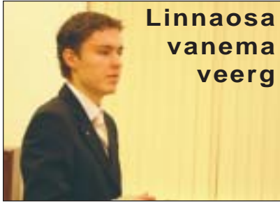
Linnaosa vanema veerg

Nurmenuku kaubanduskeskusesse rajatakse alkoholi asemele kasiino. Seaduse järgi hasartmängukoht, aga räägime ikka asjadest õigete nimedega ja otse. Rajatakse – vaatamata elanike ja linnaosavalitsuse selgele vastuseisule – otse elumajade akende alla. Seintel juba valmis suured pildid ja reklaamsilt ootab ainult voolu siselülitamist. Ei loe ühistuesimeeste selgelt põhjendatud pöördumised ega elanike allkirjad.