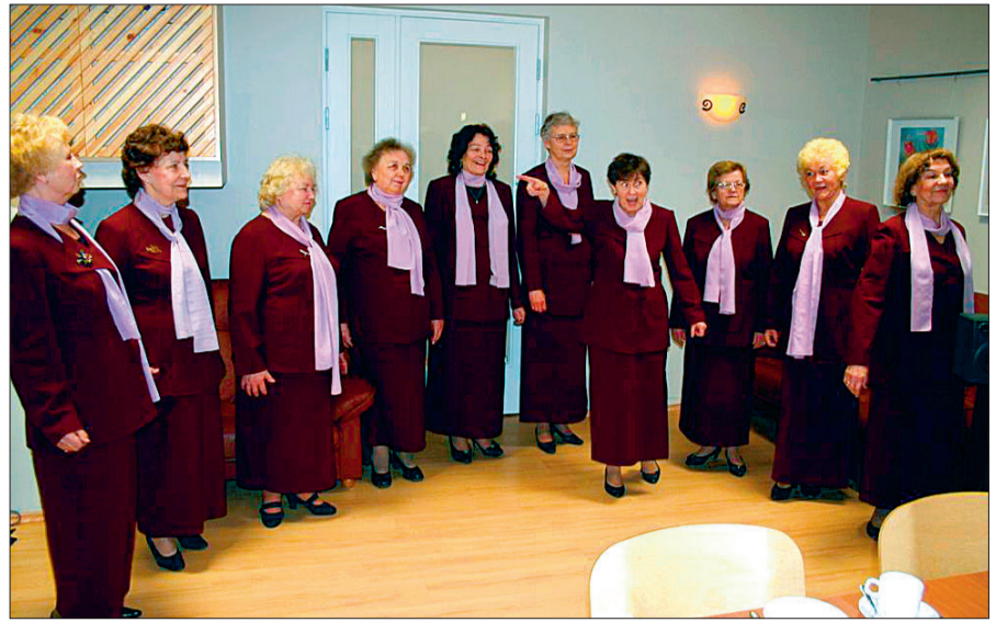
Meeleolu tõstis sotsiaalkeskuse naisansambel Miraaž.

Pärast väikest kontserti toodi lauale traditsiooniline sõdurisupp, mille juurde käis loomulikult ka pits kangemat. Meenutati sõjasündmusi, Sinimägede lahinguid ja avaldati lootust, et viimane sõda, mis eestlaste ajaloos 40., jääb ka viimaseks.