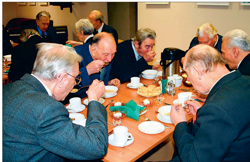
Sõdurisupp maitseb alati hea.