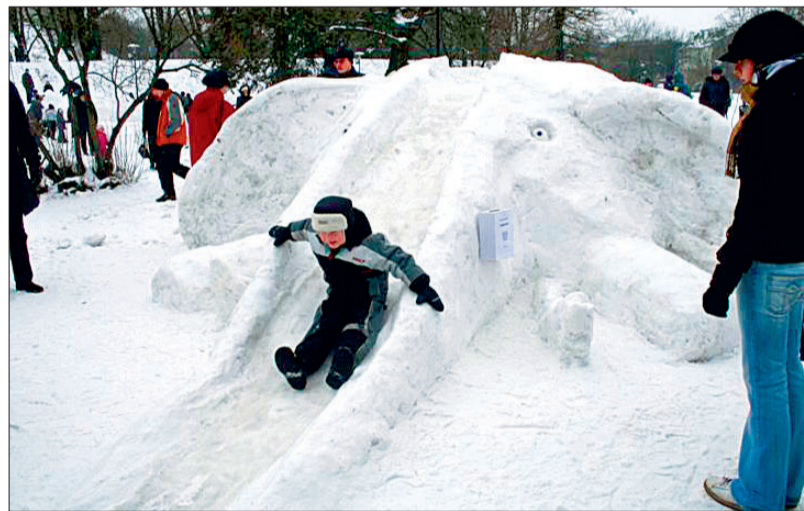
Elevandi lonti mööda sai pika liu.

Laupäeval, 18. veebruaril avati Tallinnas Snelli tiigi ääres tänavune lumelinn, mille ehitasid Tallinna Kunstigümnaasiumi, Liivalaia gümnaasiumi, Tallinna Polütehnikumi ja Arte gümnaasiumi õpilased, Pelgulinna gümnaasiumi vilistlased ning Eesti rohelise liikumise esindajad.