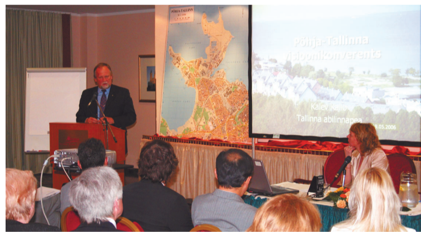
Abilinnapea Kalev Kallo tutvustab planeeritavat Sõle spordikompleksi.