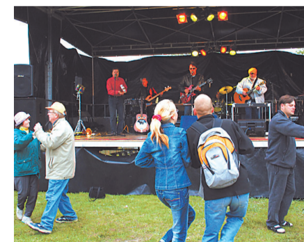
Ansambel Apelsin meelitas publi- ku hoogsate rütmide saatel tantsu- platsile. KARINA LOI

Eri vanuseklassidele korraldati täna- vakorvpalli-, lauajalgpalli- ja rannasopsu