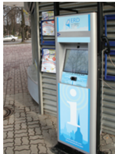
Üksikud ERD Infotulpade teenustest on sümbolise tasu eest. Tasumiseks saab lunastada plastkaardi samas asuvast R- kioskist. Sealt saab tulp ka voolu ja ühendused.

Kõik loetletud teenused on kättesaadavad juba täna, ajaga lisandub neid veel.