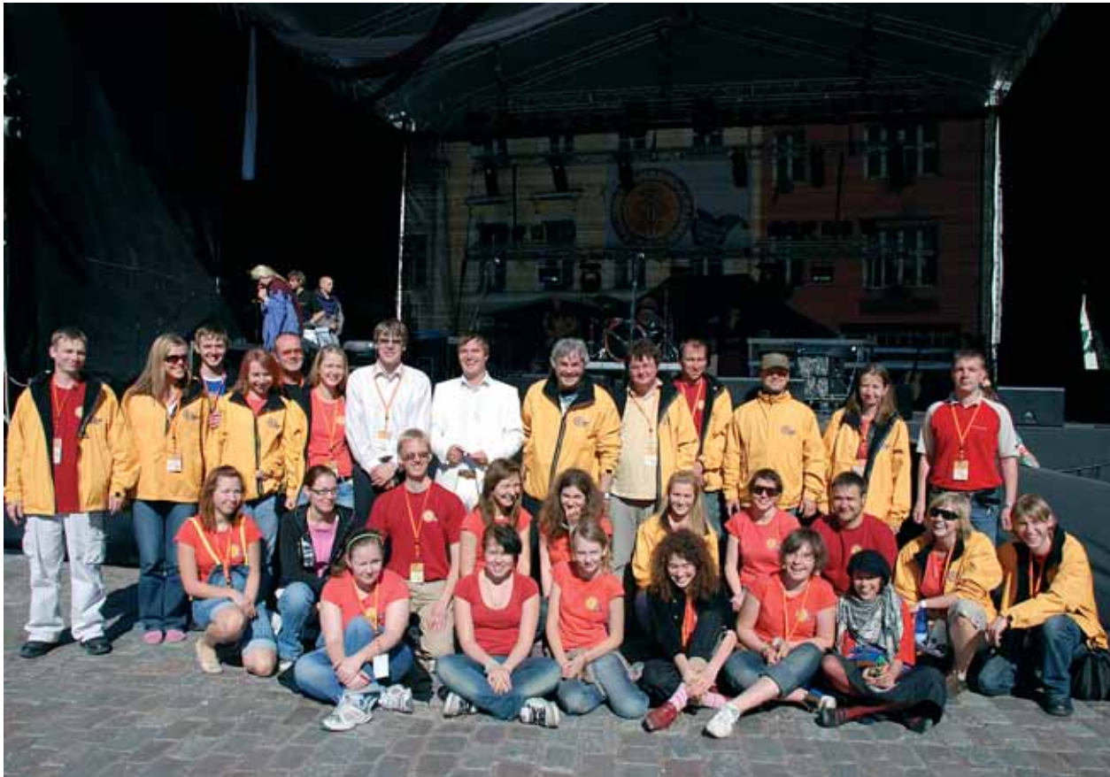
Vanalinna päevade korraldusmeeskonna nägudelt ei kadunud naerarus ka viimasel päeval.