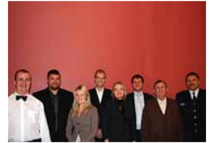
Tublid abipolitseinikud kohtumisel Keskklinna Valitsuses.