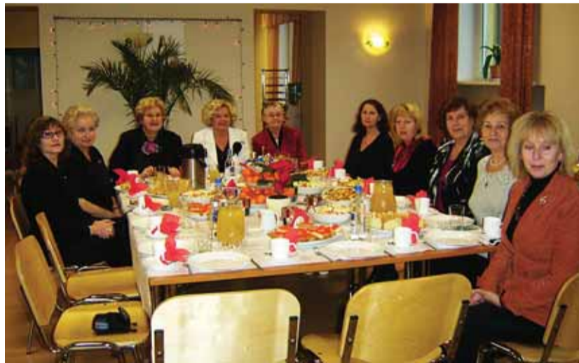
Tallinna Kesklinna Sotsiaalkeskuse kollektiiv. Kesklinna valitus tänab kõiki sotsiaaltöötajaid tehtu eest ja soovib rohkem rõõmuhetki nende raskes töös.

Hea on tõdeda, et positiivset ja rõõmustavat on sotsiaalkeskuse poolt igapäevaselt tehtavas sotsiaaltöös siiski rohkem kui murettekitavaid asjaolusid. ■