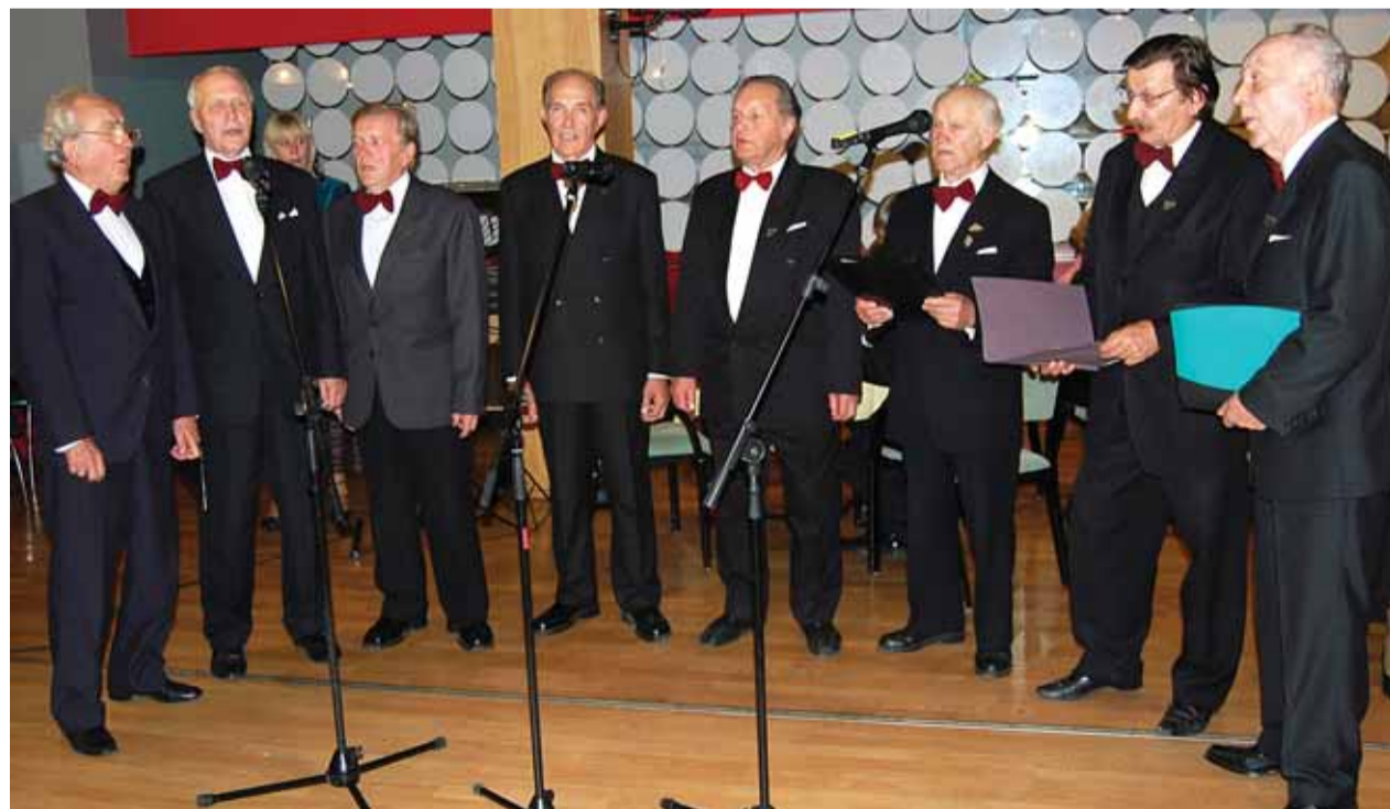
Keskklinna sotsiaalkeskuse ansambel “Vanaisad” esinemas.