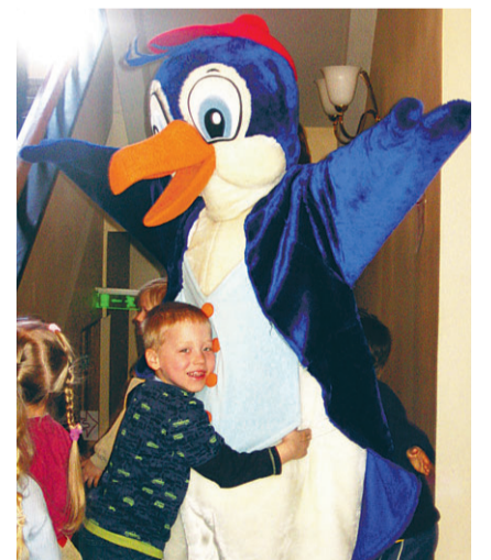
Turvapäevalt ei lahkunud ükski laps kallistusest.