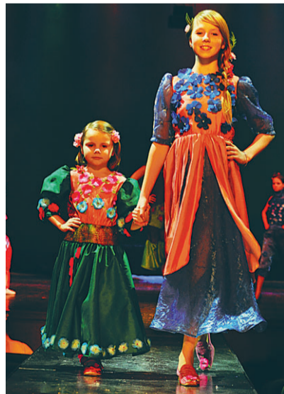
Max-Studio noorte kollektsioon «Lilled peem»

Kopli noortekeskuse moeatrituudio Max-studio noored said dip-