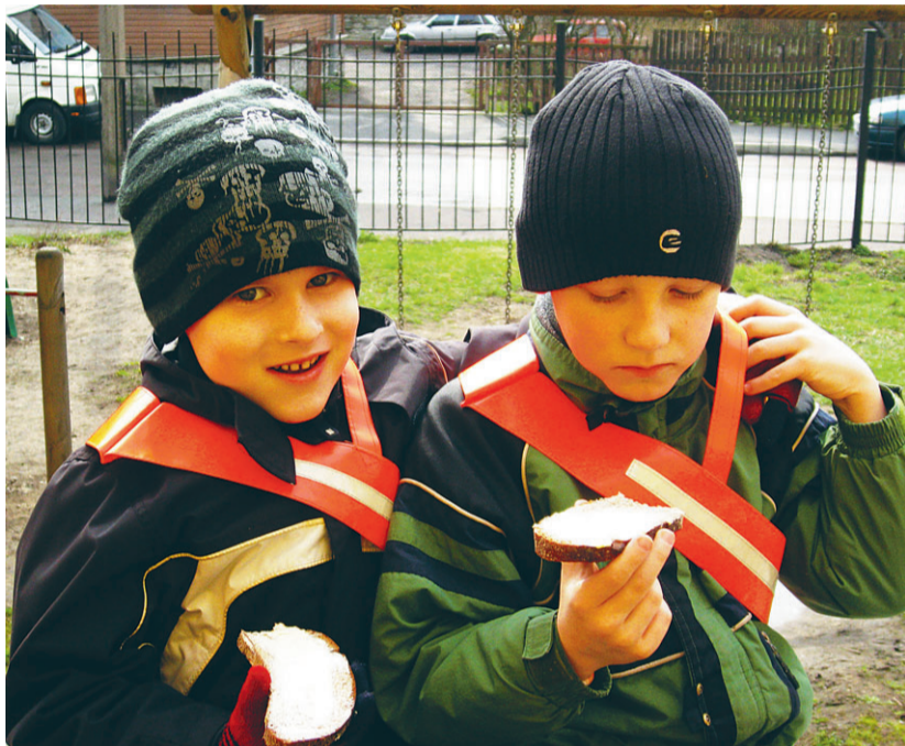
Värskes õhus maitset võileib eriti häa.