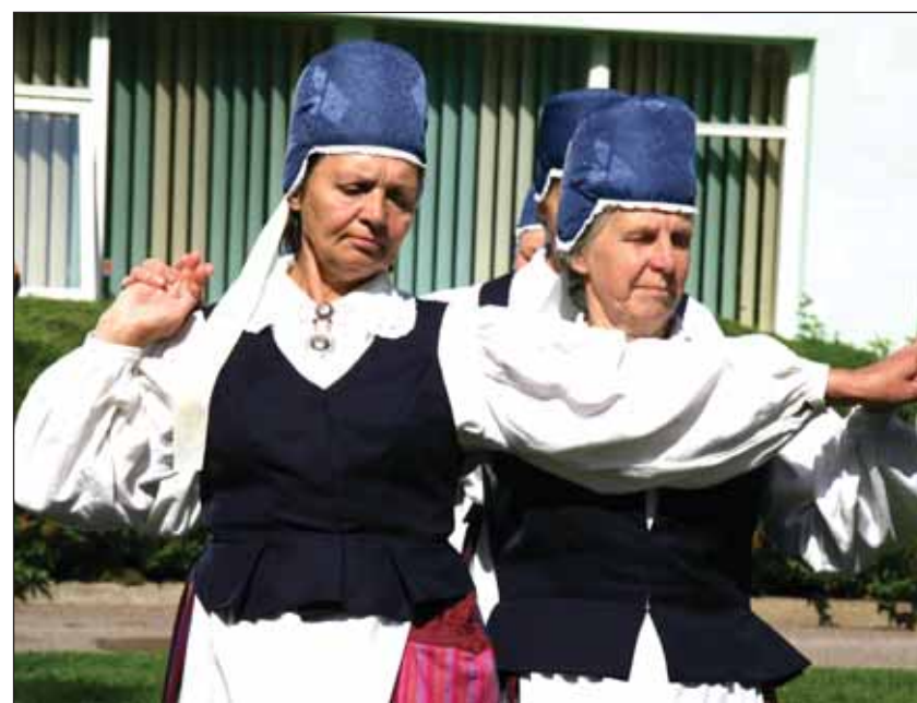
В летнем кафе социального центра регулярно проходили концерты. Неделю назад там выступали танцоры и певцы из Рийзипере и Хайба.

коллекционный сад. В саду много редких форм и цветов туй, цветущих рододендронов и давно использовавшихся в нашем садовом искусстве многолетних цветов (пионы, флоксы). Сад внешне хорошо связан с имеющимися строениями и оставляет впечатление приятного домашнего сада. Президент Республики вручит лауреатам награды 24 августа в актовом зале Таллиннского Технического университета.