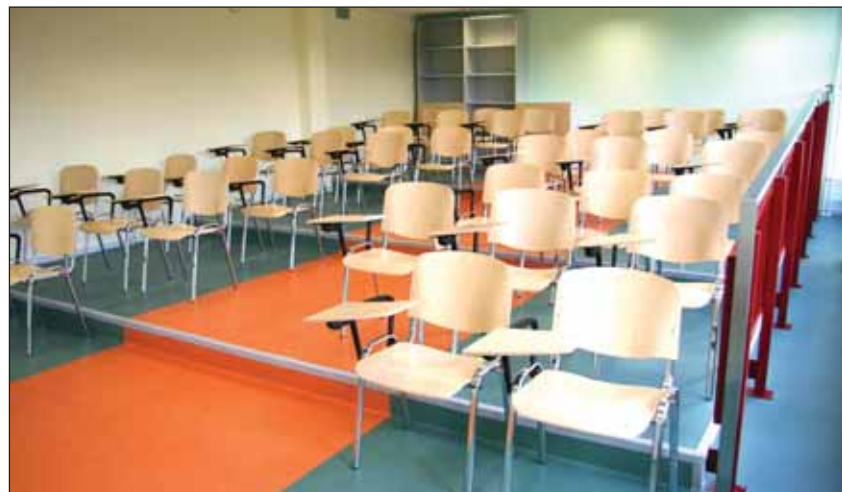
Отремонтированные и оснащенные новой мебелью классные помещения ждут учеников.

В оформлении интерьера школы использованы пастельные тона, и это создает ощущение легкости и комфорта. Школа не только прекрасно оформлена, но и оснащена всем необходимым: оснащенные предметные кабинеты, возможность пользоваться интернетом во всех школьных помещениях, в том числе и беспроводным, школьное радио, современные электронные средства обучения, просторная и уютная библиотека с читальным залом, 5 спортивных залов, оснащенный специальной техникой актовый зал и т.д.